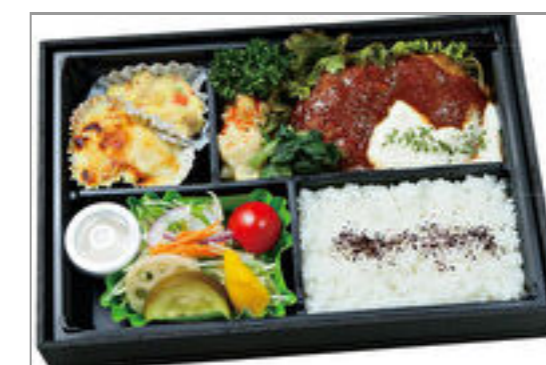
黒毛和牛のハンバーグデミグラスソース弁当