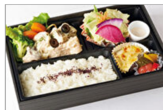
国産鶏の白ワインビネガー風味