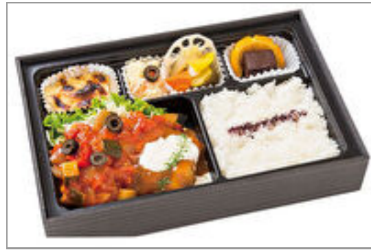
ハーブ鶏のトマトソース煮込みと ロールキャベツ弁当 デザート 付き