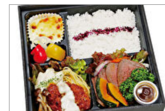
黒毛和牛のハンバーグとローストビーフ弁当