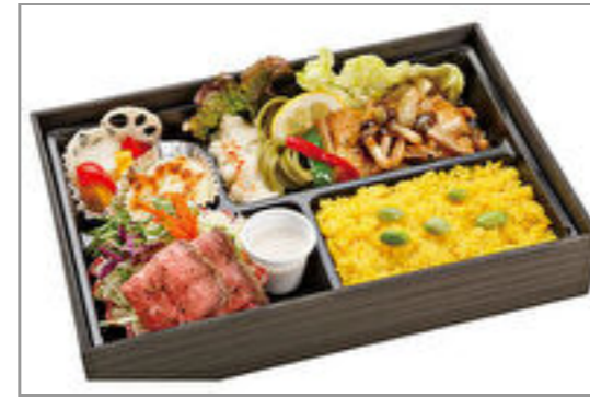
白身魚のソテー きのこと添 え