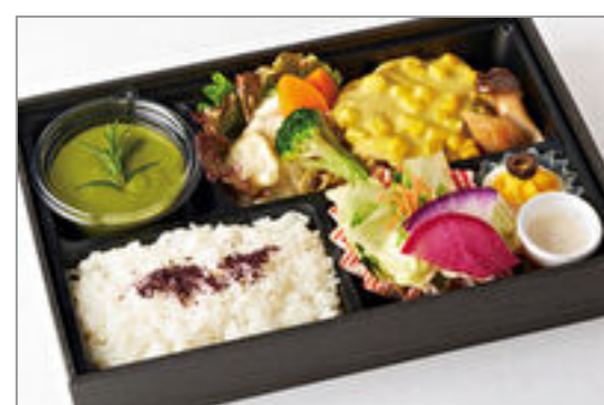
黒毛和牛のハンバーグクリームコーンソース