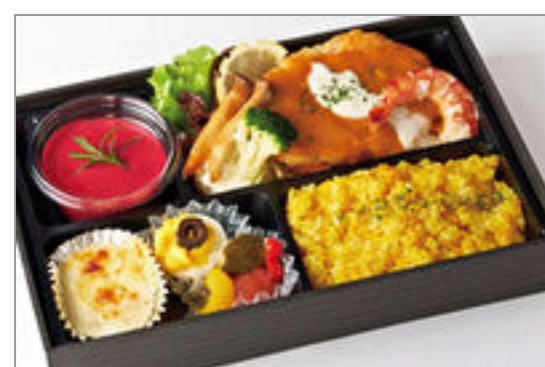
海の香りのハンバーグ

商品によっては、注文条件やオプション・サービス等がございますので、詳しくはWEBでご確認ください。