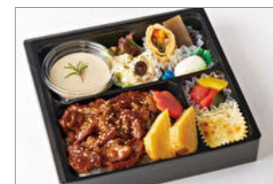
黒毛和牛のしぐれ煮御膳