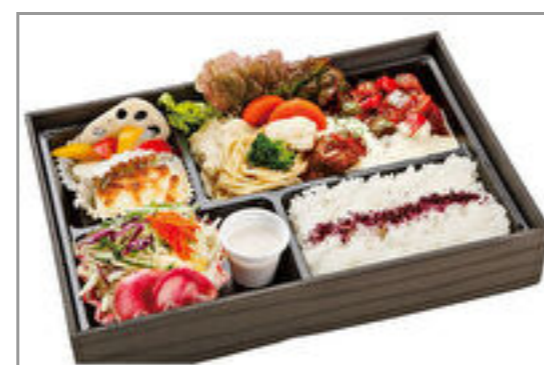
黒毛和牛のビーフシチュー弁当