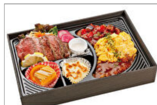
プレミアムオムライス弁当