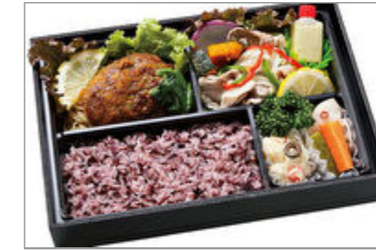
熟成牛のハンバーグと豚し ゃぶサラダ弁当