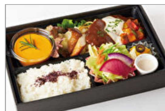
黒毛和牛のハンバーグデミグラスソース