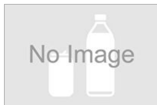
ハイピースノンカフェイン 黒豆茶(500ml ペット ボトル)