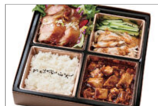
ユーリンチ&麻婆豆腐弁当