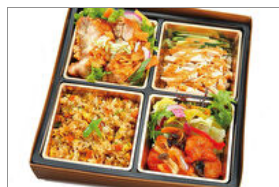
ユーリンチ&エビチリ弁当