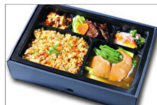
【温まる】フカヒレ姿煮&牛肉炒め&麻婆豆腐弁当