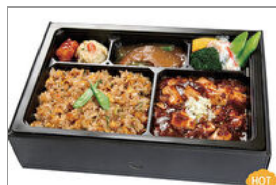
【温まる】麻婆豆腐&フカヒレ弁当