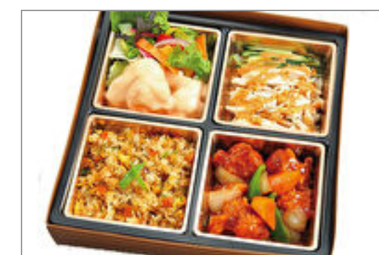
すぶた&エビマヨ弁当