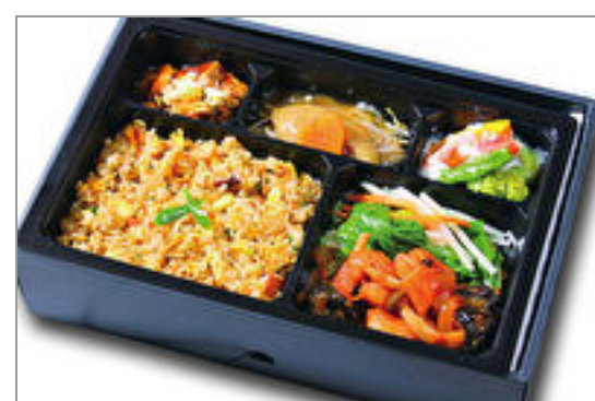
【温まる】海老チリ&フカヒレ弁当

商品によっては、注文条件やオプション・サービス等がございますので、詳しくはWEBでご確認ください。