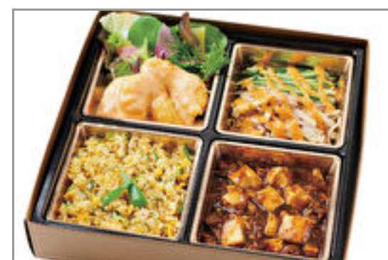
麻婆豆腐&えびマヨ弁当