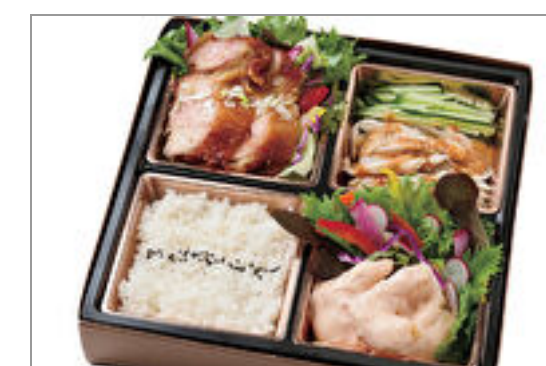
ユーリンチ&えびマヨ弁当