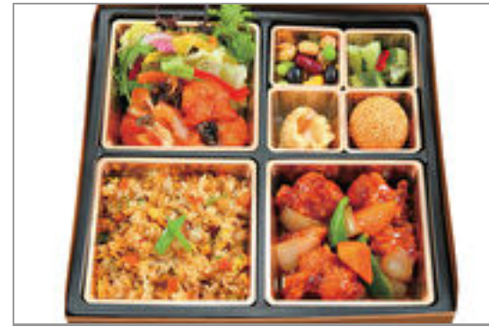
すぶた&エビチリ弁当