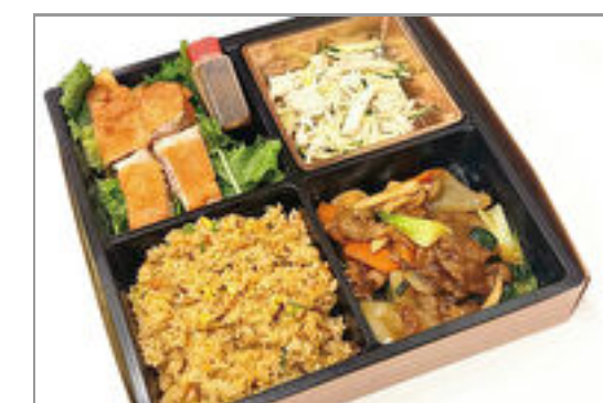
ユーリンチ&牛肉炒め弁当