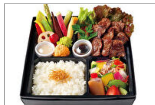
牛ハラミステーキと季節野菜のバーニャカウダ弁当