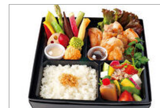
鳥取県大山鶏(だいせんどり)と季節野菜のバーニャカウダ弁当