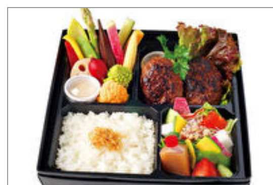
和牛ともち豚のハンバーグと季節野菜のバーニャカウダ弁当