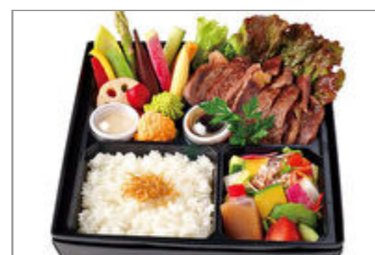
阿波の黒毛和牛サーロインと季節野菜のバーニャカウダ弁当