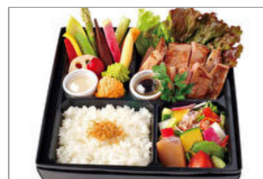
瑞穂野もち豚と季節野菜のバーニャカウダ弁当