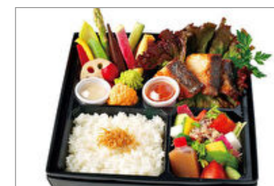
鮮魚の鉄板焼きと季節野菜のバーニャカウダ弁当