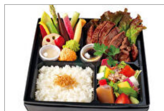
阿波の黒毛和牛フィレと季節野菜のバーニャカウダ弁当

商品によっては、注文条件やオプション・サービス等がございますので、詳しくは WEB でご確認ください。