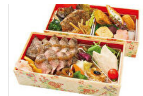
麦藁膳(むぎわらぜん)