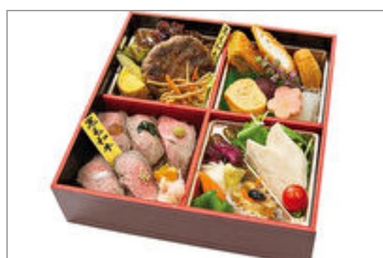
青雉膳(あおきじぜん)