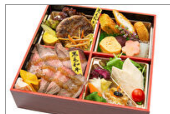
藤虎膳(ふじとらぜん)