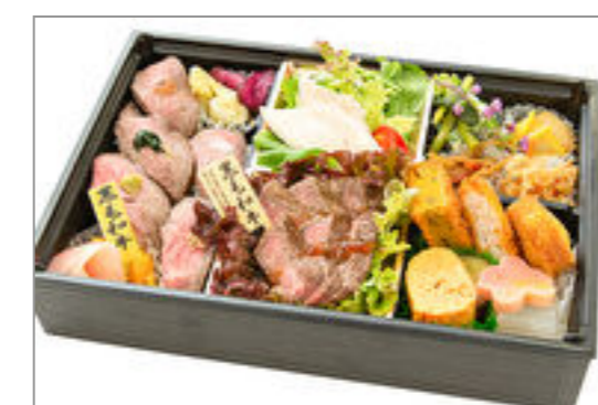
緑牛膳(りよくぎゅうぜん)