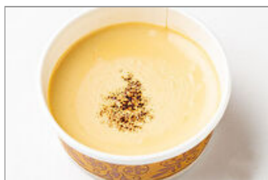
和三蜜のブリュレ(デザート)