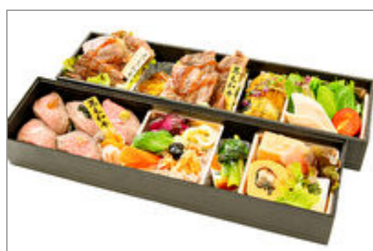
黄猿膳(きざるぜん)

商品によっては、注文条件やオプション・サービス等がございますので、詳しくはWEBでご確認ください。