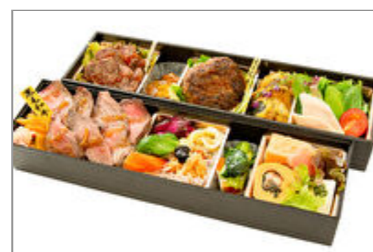
赤犬膳(あかいぬぜん)