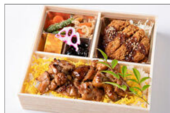
自家製ダレの味噌カツと炭火焼鳥重御膳