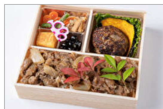
自家製ハンバーグ&すき焼 き重御膳