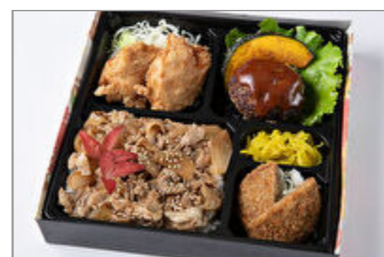
自家製デミグラスハンバーグ・鶏の唐揚げ・メンチカツの焼肉カルビ重 1,389円(税込1,500円) / 品番:HGFF063