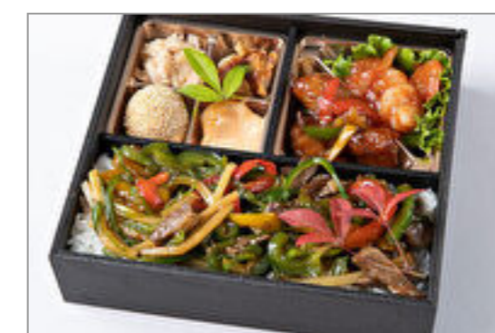
酢豚&エビチリ&チンジャ オロース重御膳