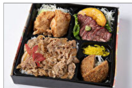
特選サーロインステーキ・鶏の唐揚げ・メンチカツの焼肉カルビ重 1,389円(税込1,500円) / 品番:HGFF059