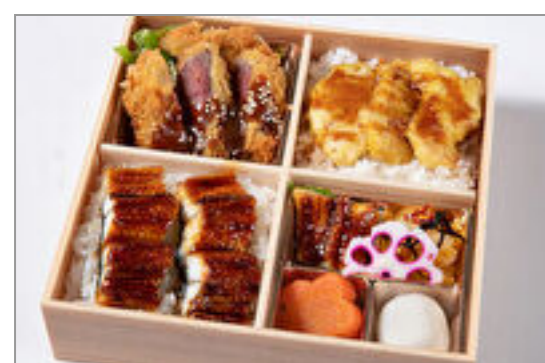
牛フィレ味噌カツと鶏天重 ・鰻重の贅沢御膳