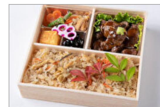
サイコロステーキと炊き込み御膳 1,389円(税込1,500円) / 品番:HGFF093