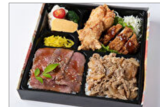
ローストビーフ重と焼肉カルビ重のDXフライ 1,389円(税込1,500円) / 品番:HGFF058