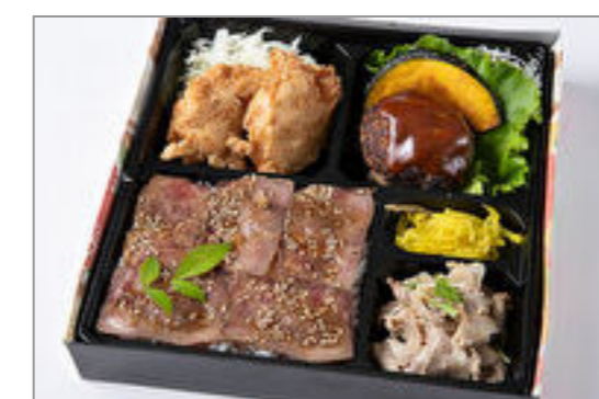
自家製デミグラスハンバーグ・鶏の唐揚げ・しゃぶしゃぶのローストビーフ重 1,389円(税込1,500円) / 品番:HGFF064