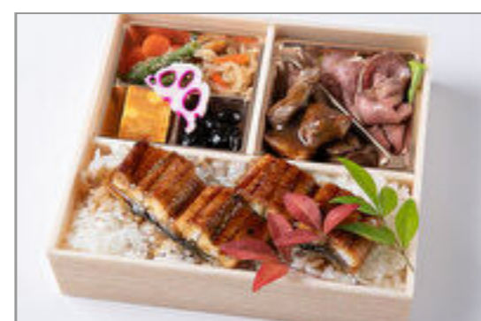
サイコロステーキ&ロース トビーフと鰻重御膳