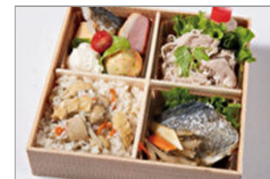
焼き魚と厳選牛しゃぶしゃ ぶのおもてなし御膳 1,797円(税込1,940円) / 品番:HGFF131 お茶付き