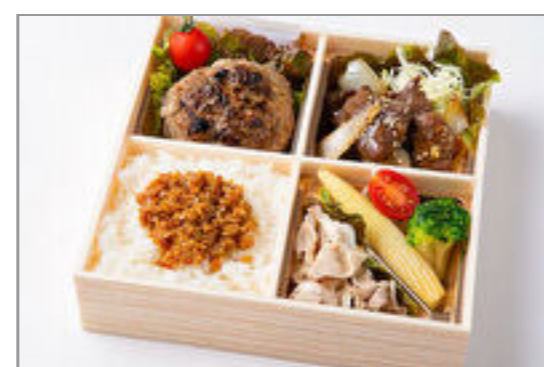
てごねハンバーグ&焼肉ハラミ御膳