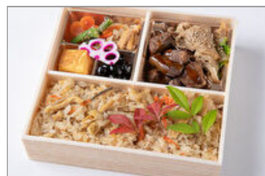
サイコロステーキ&焼肉カルビと炊き込み御膳 1,389円(税込1,500円) / 品番:HGFF094