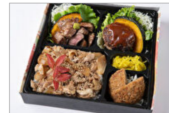
サイコロステーキ・デミグラスハン バーグ・メンチカツの焼肉カル ビ重