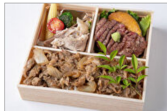
特選サーロインステーキ& すき焼き重御膳