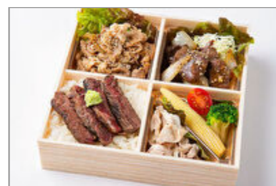
焼肉ハラミ&カルビとサーロインステーキ重御膳