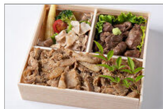
サイコロステーキ&焼肉カルビ重御膳