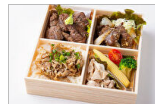
サイコロステーキ&焼肉ハラミとカルビ重御膳