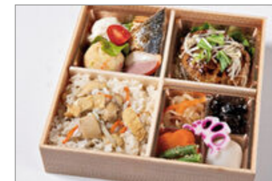
和風餡かけハンバーグと炊 き込みご飯のおもてなし御 膳 2,000円(税込2,160円) / 品番:HGFF128 お茶付き