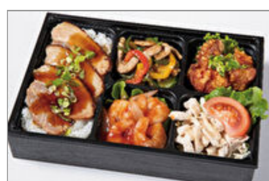
チンジャオロースと本格エ ビチリの焼豚重弁当