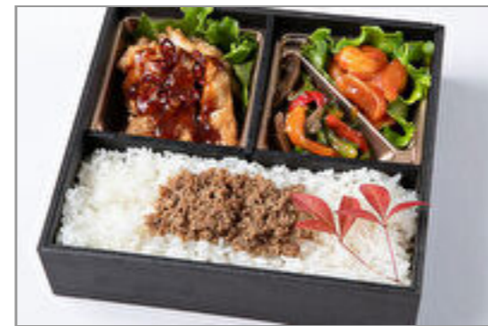
チンジャオロース&エビチ リ&ユーリンチー御膳 1,389円(税込1,500円) / 品番:HGFF115