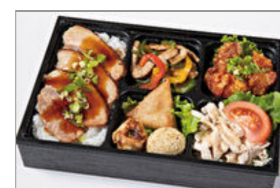
チンジャオロースと油淋鶏 の焼豚重弁当