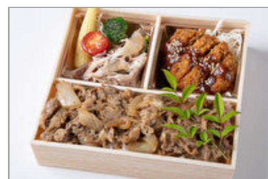
厳選ロースかつ&すき焼き重御膳