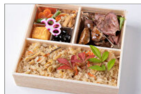
サイコロステーキ&ローストビーフと炊き込み御膳 1,389円(税込1,500円) / 品番:HGFF092