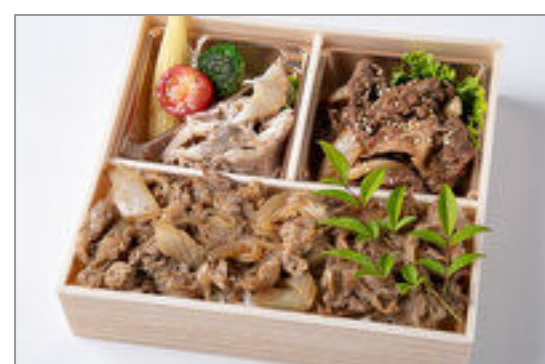
厳選焼肉カルビ&すき焼き重御膳