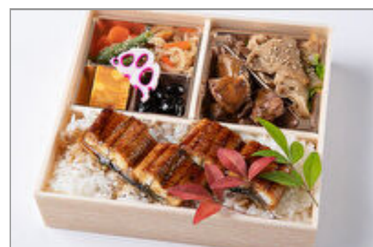
サイコロステーキ&焼肉カ ルビと鰻重御膳