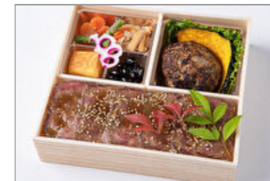
自家製和風ハンバーグとロ ーストビーフ重御膳