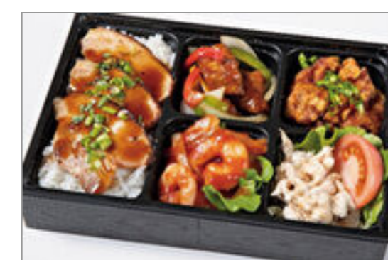
黒酢酢豚と本格エビチリの 焼豚重弁当