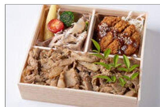
厳選ロースカツ&焼肉カルビ重御膳