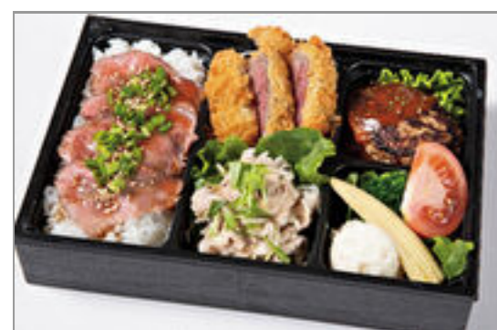
特上フィレカツ・デミハン バーグ・牛しゃぶとロース トビーフ重 2,000円(税込2,160円) / 品番:HGFF138 お茶付き