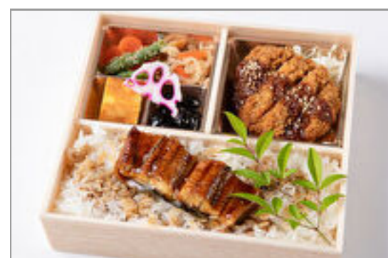
味噌カツと鶏天重・すき焼 き重御膳