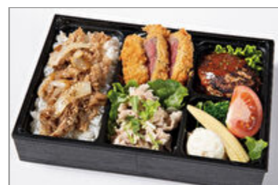
特上フィレカツ・デミハン バーグ・牛しゃぶと焼肉カ ルビ重 2,000円(税込2,160円) / 品番:HGFF136 お茶付き