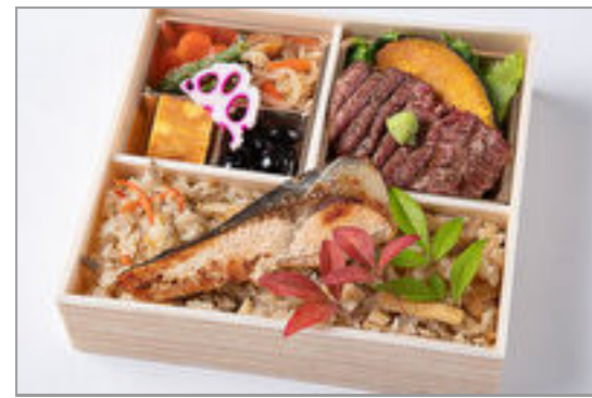
特選牛サーロインステーキ と銀鮭の幽庵焼きの炊き込 み御膳