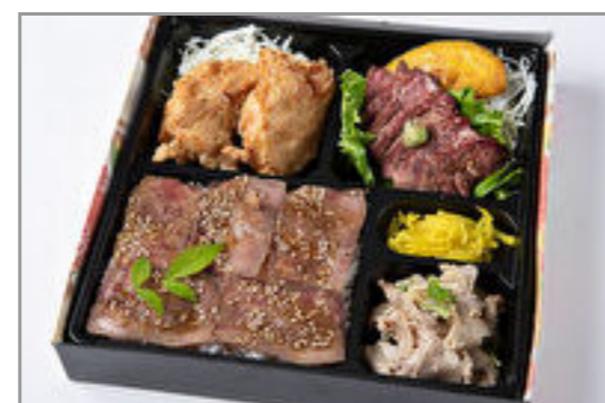
特選サーロインステーキ・鶏の唐揚げ・しゃぶしゃぶのローストビーフ重 1,389円(税込1,500円) / 品番:HGFF060