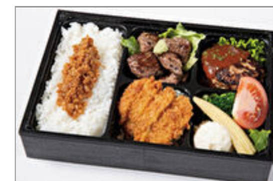
サイコロフィレ・特製デミハンバ ーグ・ロースカツの3種の肉づ くし 1,797円(税込1,940円) / 品番:HGFF140 お茶付き