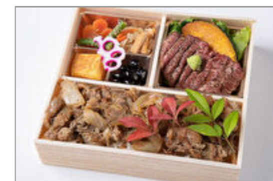
特選サーロインステーキと すき焼き重御膳