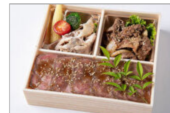
厳選焼肉カルビ&ローストビーフ重御膳