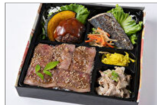
自家製デミグラスハンバーグ・魚の塩焼き・しゃぶしゃぶのローストビーフ重 1,389円(税込1,500円) / 品番:HGFF057