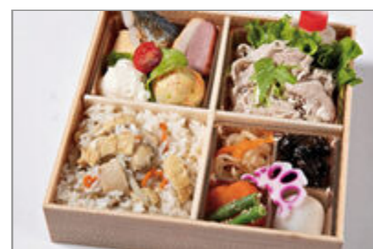
厳選牛しゃぶしゃぶと炊き 込みご飯のおもてなし御膳 1,500円(税込1,620円) / 品番:HGFF133 お茶付き