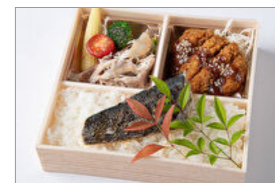
厳選ロースカツ&季節の魚の幽庵焼き御膳