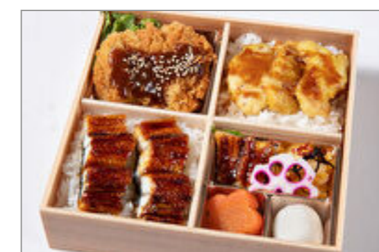
味噌カツと鶏天重・鰻重の 贅沢御膳