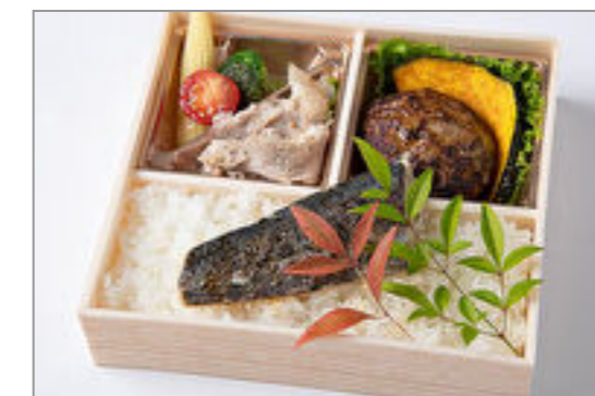
自家製ハンバーグ&季節の 魚幽庵焼き御膳