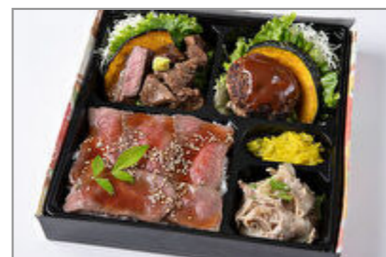
サイコロステーキ・デミグラスハン バーグ・しゃぶしゃぶのロース トビーフ重