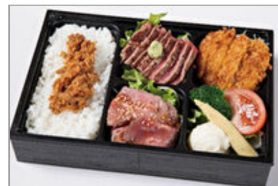
特選サーロイン・ロースカツ・ローストビーフの3種の肉づくし