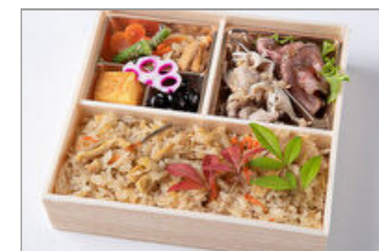
ローストビーフ&しゃぶしゃぶと炊き込み御膳 1,389円(税込1,500円) / 品番:HGFF096