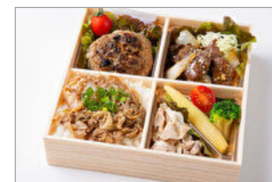
てごねハンバーグ&焼肉ハラミとカルビ重御膳