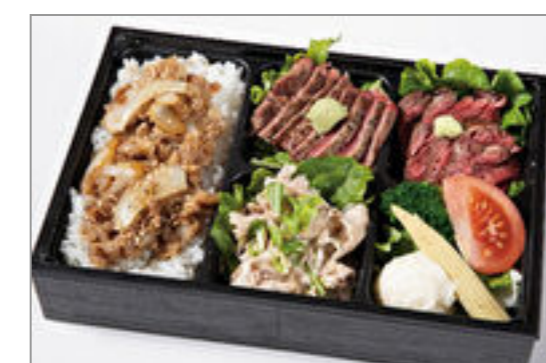
特選サーロイン・ハラミ・ 牛しゃぶと焼肉カルビ重 2,000円(税込2,160円) / 品番:HGFF137 お茶付き