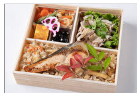
厳選しゃぶしゃぶと銀鮭の 幽庵焼きの炊き込み御膳