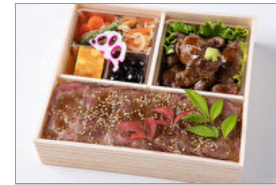
サイコロステーキとロース トビーフ重御膳