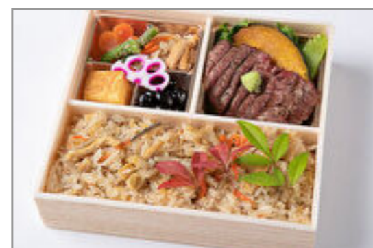
特選サーロインステーキと炊き込み御膳 1,389円(税込1,500円) / 品番:HGFF095