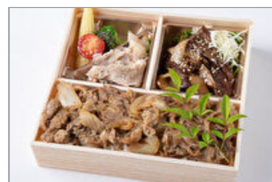
厳選焼肉ハラミ&すきやき 重御膳