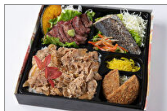
特選サーロインステーキ・魚の塩焼き・メンチカツの焼肉カルビ重 1,389円(税込1,500円) / 品番:HGFF062