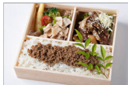
厳選焼肉ハラミ&自家製牛そばろ重御膳