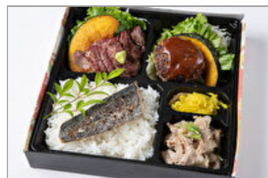
特選サーロインステーキ・デミグ ラスハンバーグ・しゃぶしゃぶの 魚の塩焼きのせご飯