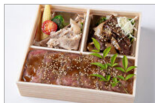
厳選焼肉ハラミ&ロースト ビーフ重御膳