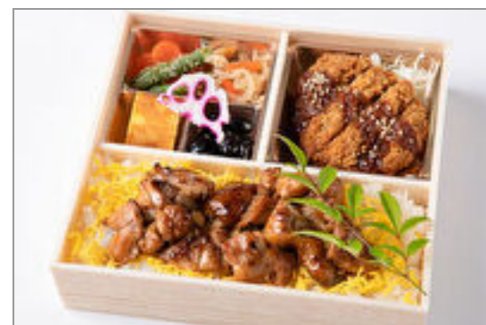
味噌カツと季節の天麩羅の そばろ重御膳