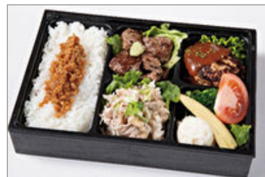
サイコロフィレ・特製デミハンバーグ・牛しゃぶの3種の肉づくし