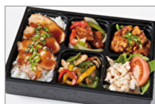
黒酢酢豚とチンジャオロー スの焼豚重弁当