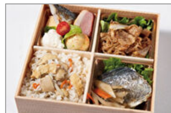
焼き魚と厳選牛すき焼きの おもてなし御膳 1,797円(税込1,940円) / 品番:HGFF130 お茶付き