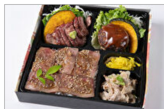
特選サーロインステーキ・デミグ ラスハンバーグ・しゃぶしゃぶの ローストビーフ重