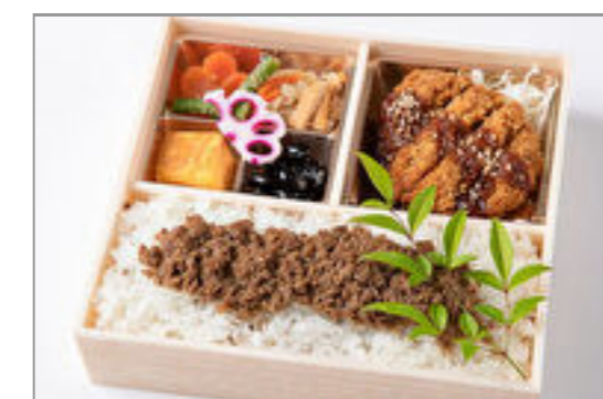
自家製ダレの味噌カツと牛そばろ重御膳