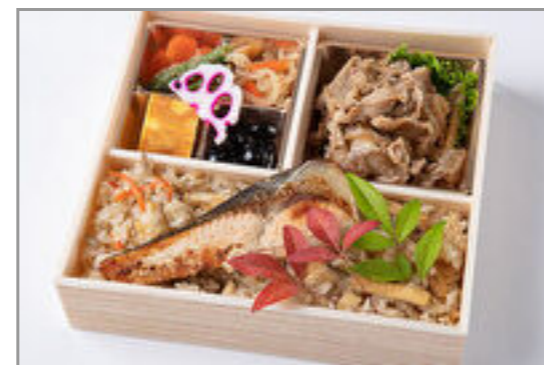
特選すき焼きと銀鮭の幽庵 焼きの炊き込み御膳