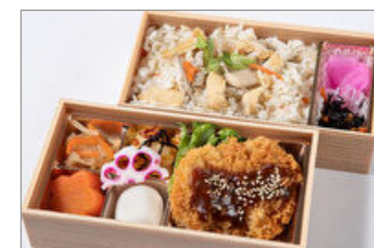
味噌カツと炊き込みご飯の贅沢御膳