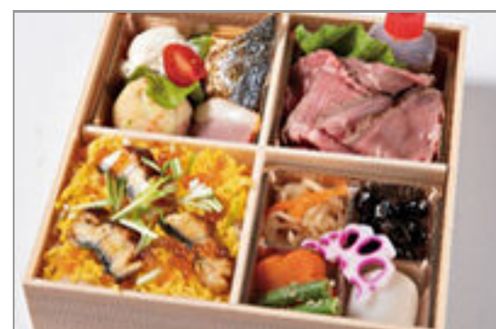
海鮮ちらしとローストビー フのおもてなし御膳 2,000円(税込2,160円) / 品番:HGFF129 お茶付き