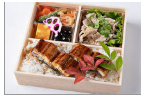
厳選しゃぶしゃぶと鰻重御 膳