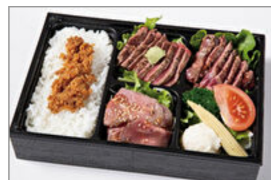
特上フィレ・サーロイン・ ローストビーフの贅沢肉づ くし 2,000円(税込2,160円) / 品番:HGFF139 お茶付き