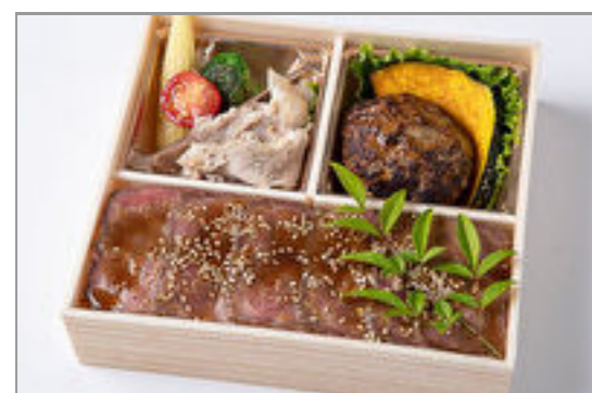
自家製ハンバーグ&ロース トビーフ重御膳