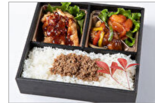
酢豚&エビチリ&ユーリン チー御膳 1,389円(税込1,500円) / 品番:HGFF116