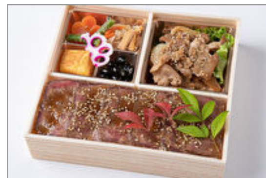
厳選焼肉カルビとロースト ビーフ重御膳