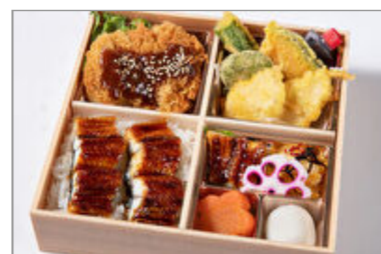
味噌カツと季節の天麩羅の 鰻重御膳