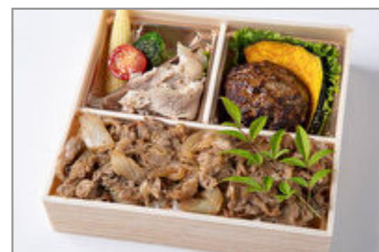
自家製ハンバーグ&すきや き重御膳