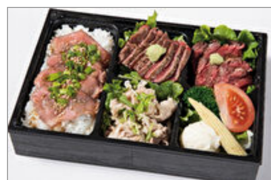
特選サーロイン・ハラミ・ 牛しゃぶとローストビーフ 重 2,000円(税込2,160円) / 品番:HGFF135 お茶付き