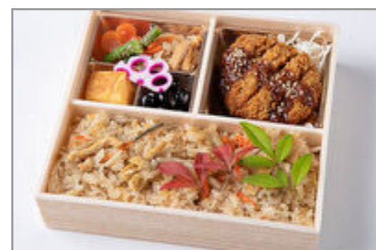
特上牛フィレカツと炊き込 み御膳