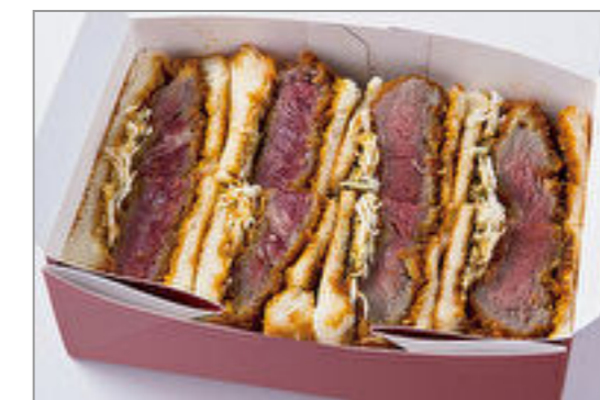
特上フィレカツサンド