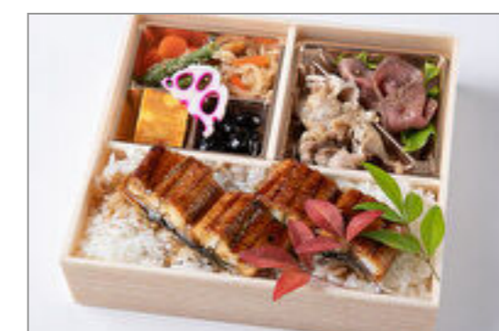
ローストビーフ&しゃぶし ゃぶと鰻重御膳