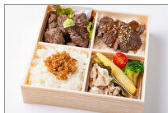
サイコロステーキ&焼肉ハラミ重御膳

商品によっては、注文条件やオプション・サービス等がございますので、詳しくはWEBでご確認ください。