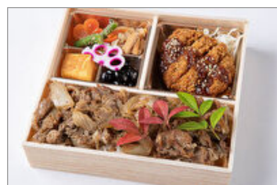
自家製ダレの味噌カツとすき焼き重御膳 1,389円(税込1,500円) / 品番:HGFF091