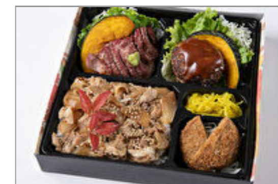
特選サーロインステーキ・デミグ ラスハンバーグ・メンチカツの焼 肉カルビ重