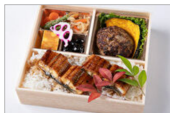
自家製和風ハンバーグと鰻 重御膳