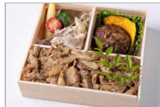
自家製ハンバーグ&焼肉カ ルビ重御膳