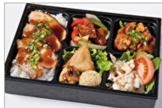
黒酢酢豚と油淋鶏の焼豚重 弁当 1,500円(税込1,620円) / 品番:HGFF126 お茶付き