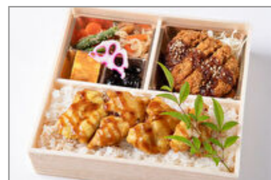
自家製ダレの味噌カツと鶏天重御膳