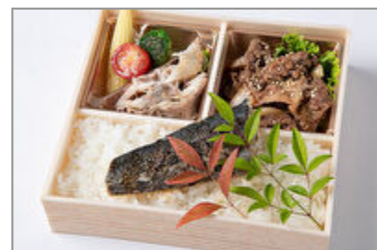
厳選焼肉カルビ&季節の魚幽庵焼き御膳