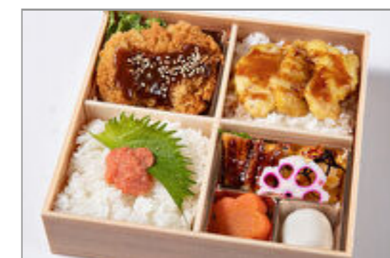
味噌カツと鶏天重・明太子 ご飯御膳