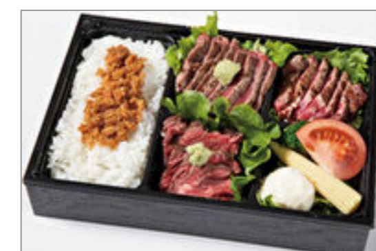
特上フィレ・サーロイン・ ハラミの極上ステーキづく し 2,315円(税込2,500円) / 品番:HGFF134 お茶付き