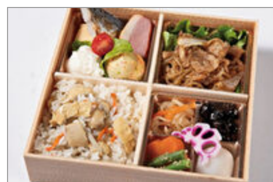
厳選牛すき焼きと炊き込み ご飯のおもてなし御膳 1,500円(税込1,620円) / 品番:HGFF132 お茶付き