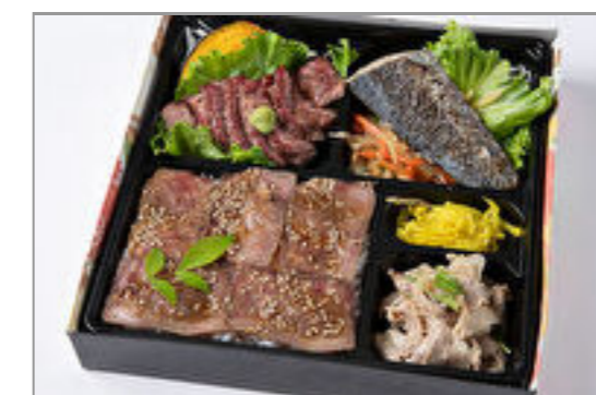
特選サーロインステーキ・魚の塩焼き・しゃぶしゃぶのローストビーフ重 1,389円(税込1,500円) / 品番:HGFF061