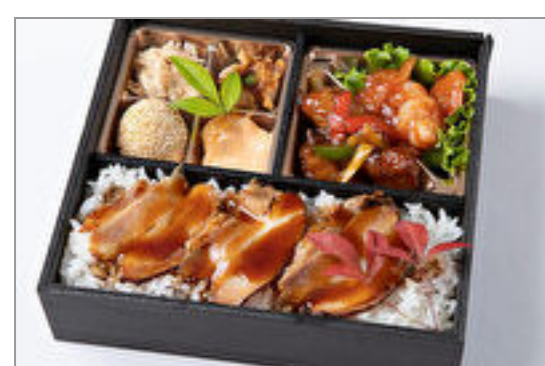
酢豚&エビチリ&特製焼き 豚重御膳