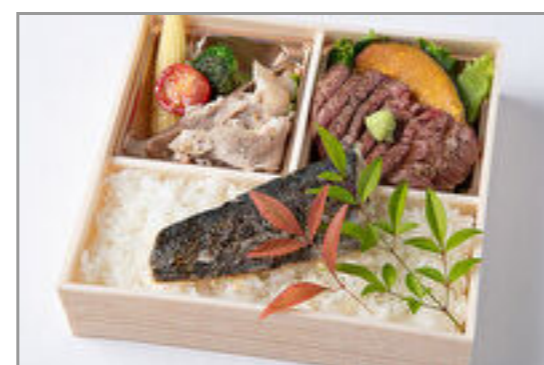
特選サーロインステーキ&季節の魚幽庵焼き御膳