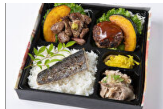
サイコロステーキ・デミグラスハン バーグ・しゃぶしゃぶの魚の塩 焼きのせご飯