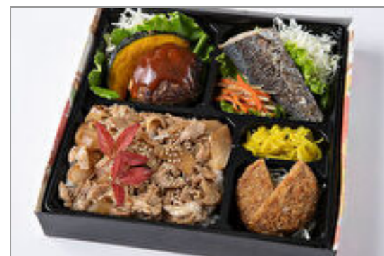
自家製デミグラスハンバーグ・魚の塩焼き・メンチカツの焼肉カルビ重 1,389円(税込1,500円) / 品番:HGFF056