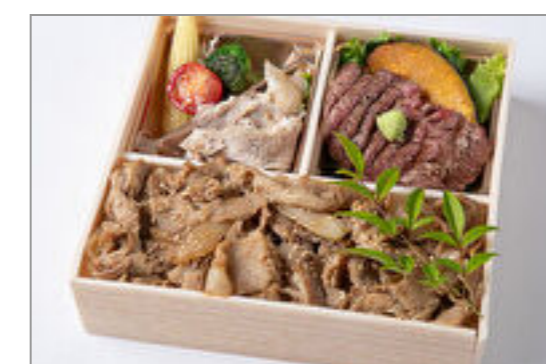
特選サーロインステーキ& 焼肉カルビ重御膳