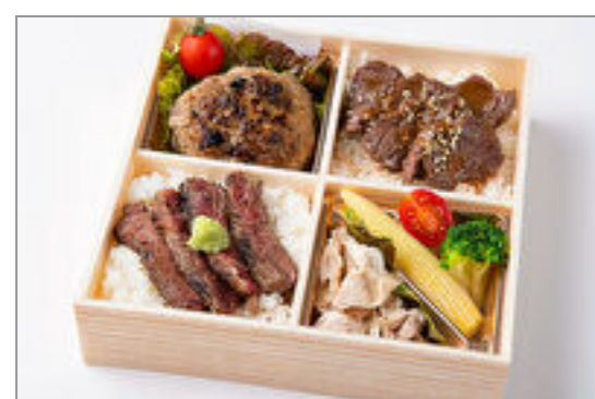
てごねハンバーグ&焼肉ハラミ重とサーロインステーキ重御膳