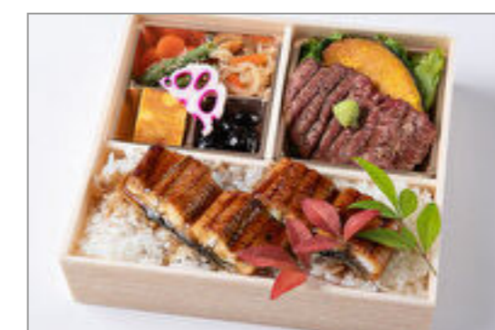
特選サーロインステーキと 鰻重御膳