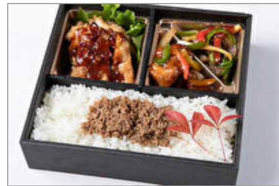
酢豚&チンジャオロース& ユーリンチー御膳 1,389円(税込1,500円) / 品番:HGFF114