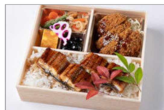
特上牛フィレカツと鰻重御 膳