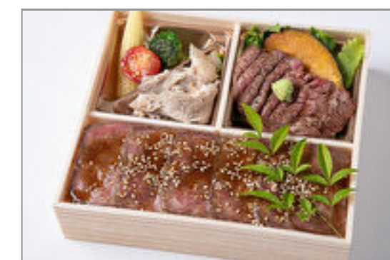
特選サーロインステーキ&ローストビーフ重御膳