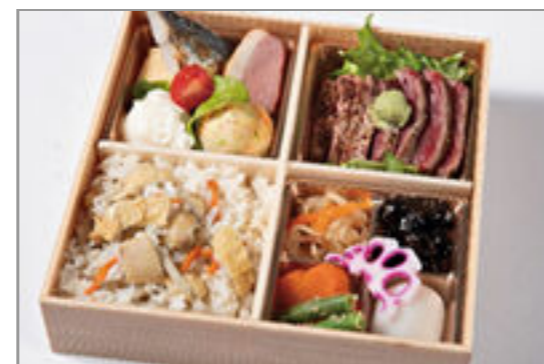
特上フィレステーキと炊き 込みご飯のおもてなし御膳 2,315円(税込2,500円) / 品番:HGFF127 お茶付き