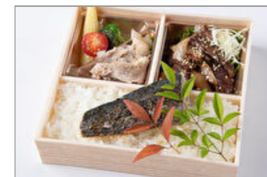
厳選焼肉ハラミ&季節の魚 の幽庵焼き御膳