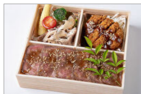
厳選ロースかつ&ローストビーフ重御膳