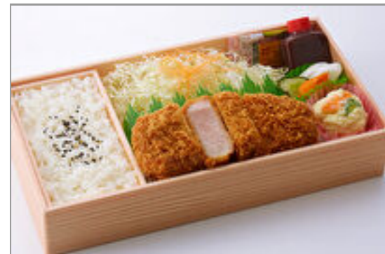
ローズかつ弁当(大/170g)