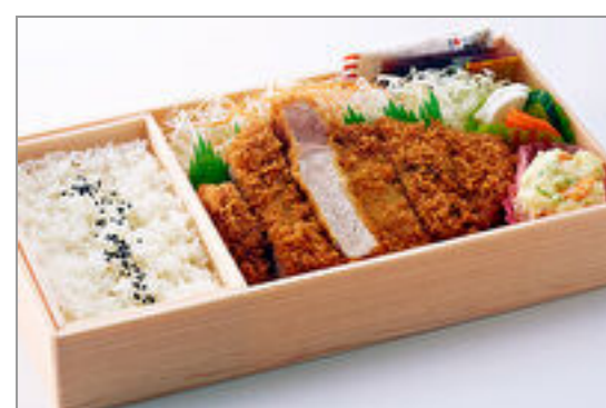
伊予いも豚リブローズかつ弁当(170g)

商品によっては、注文条件やオプション・サービス等がございますので、詳しくはWEBでご確認ください。