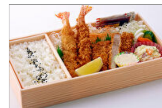
天然海老フライ・ローズかつ弁当