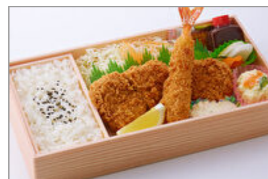
とんとんにぎわい弁当(中)