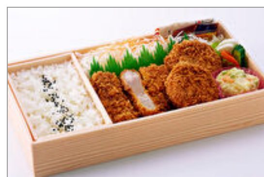
ひれかつ・ローズかつ弁当