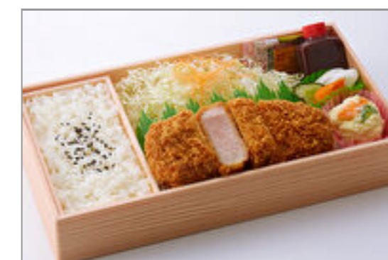
伊予いも豚ローズかつ弁当(130g)