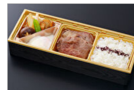
国産牛すき焼き弁当