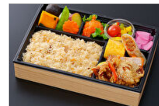
炊き込み彩り弁当