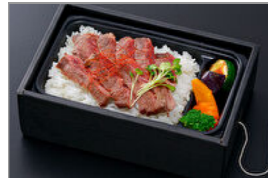
【温まる】暖々ステーキ御膳