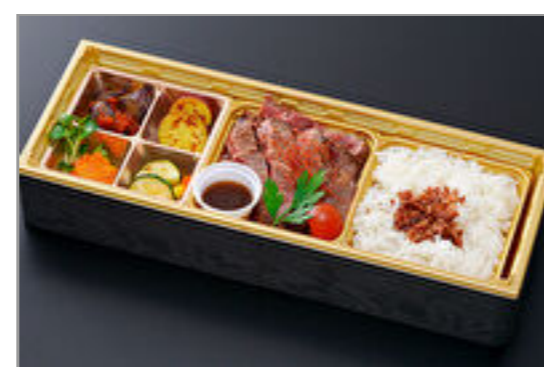
牛ロースステーキ弁当