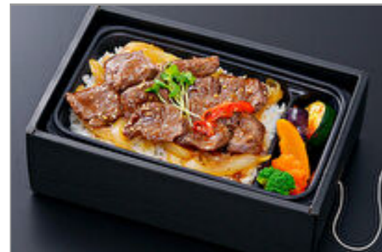
【温まる】暖々牛ハラミ弁当