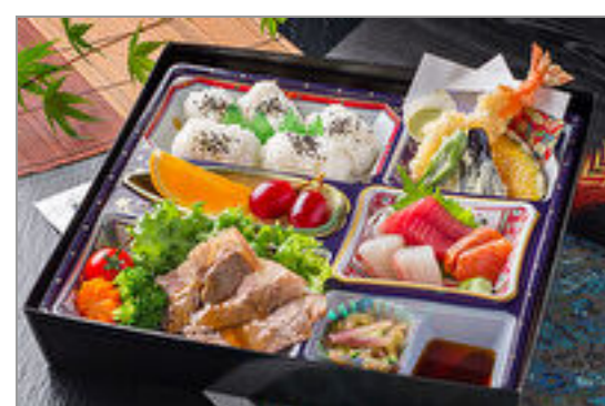
やわらか牛ステーキ膳