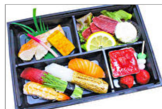
金目鯛と峯野牛のたたき御膳