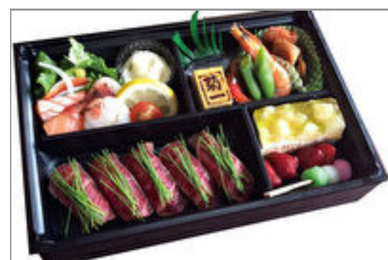
峯野牛のにぎり御膳