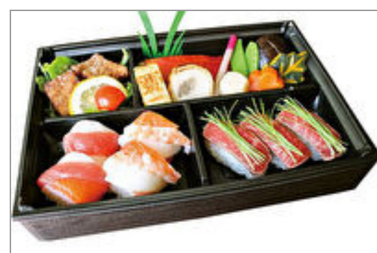
金目鯛と手綱寿司の華やか御膳