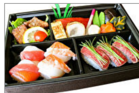
金目鯛の幽庵焼と手綱寿司の華やか御膳