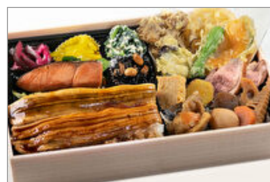
煮穴子の幕の内弁当

商品によっては、注文条件やオプション・サービス等がございますので、詳しくは WEB でご確認ください。