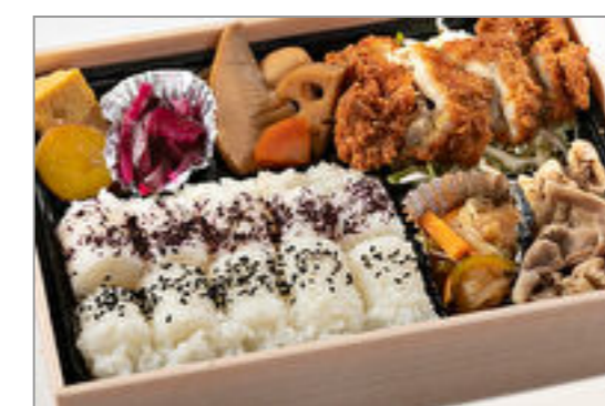
チキンカツの和洋折衷弁当