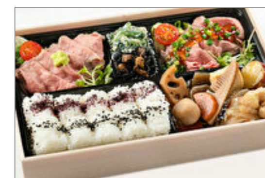
和風ローストビーフ食べ比べ弁当