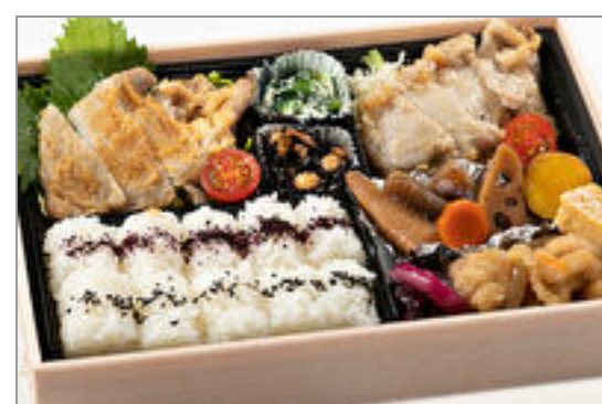
豚ロース2種類の味噌焼き弁当