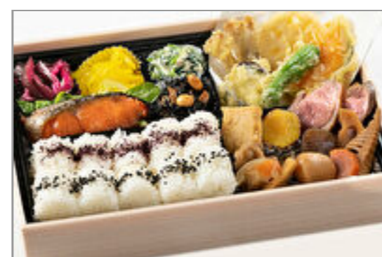
えびす庵の幕の内弁当