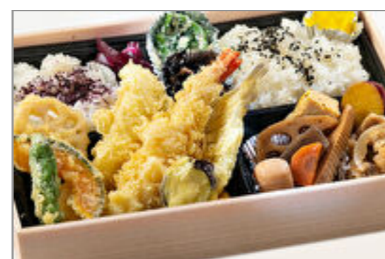
蕎麦屋の天麩羅で定食弁当