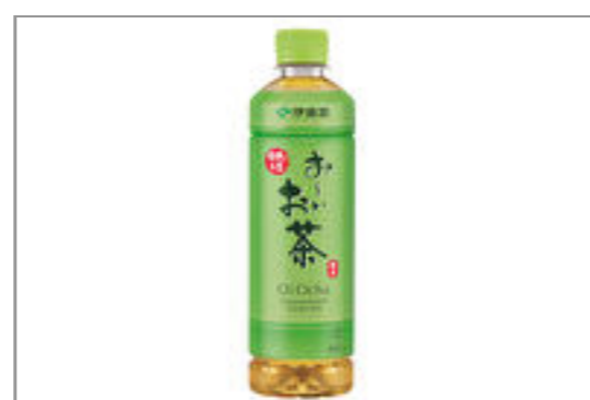
お〜いお茶(460ml ペットボトル)