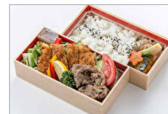
牛カツとしゃぶ焼き弁当