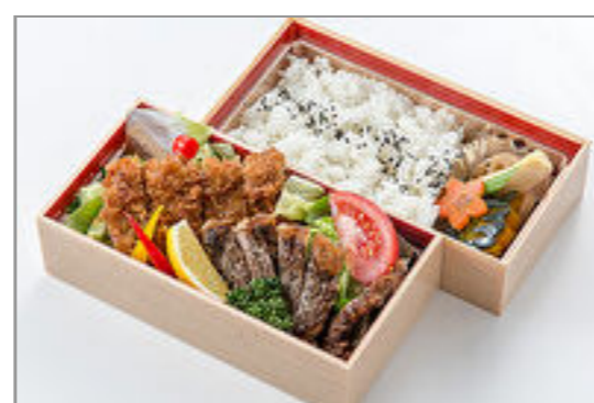
牛カツとステーキ弁当