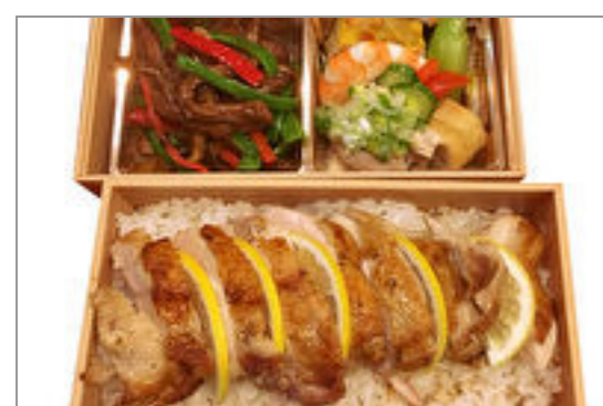
ハーブチキンのステーキ弁当

商品によっては、注文条件やオプション・サービス等がございますので、詳しくは WEB でご確認ください。