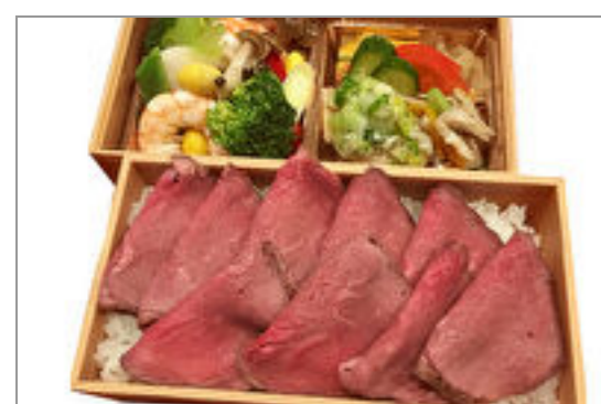
ローストビーフ弁当