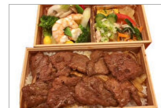
熟成牛肉の黒胡椒焼弁当