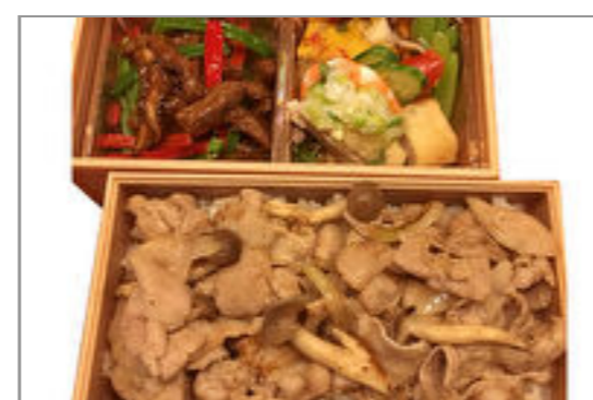
吉岐産うずしおポークの生姜焼弁当