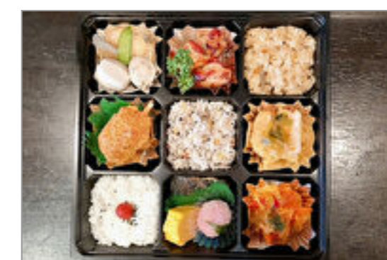
九仕切御膳～彩花(あやか)～