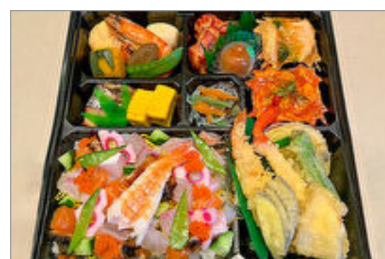
バラちらし寿司御膳～華(はな)～