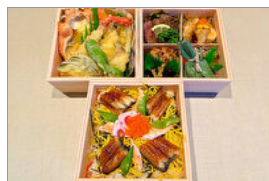
おまかせ三段重(匠)

商品によっては、注文条件やオプション・サービス等がございますので、詳しくは WEB でご確認ください。