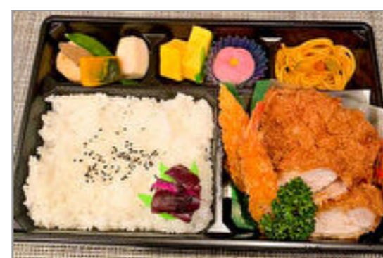
三元豚ロースカツ御膳～雅(みやび)～