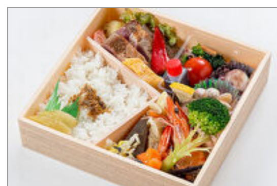
和風牛ステーキ御膳

商品によっては、注文条件やオプション・サービス等がございますので、詳しくは WEB でご確認ください。