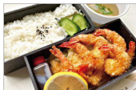
小海老フライ弁当