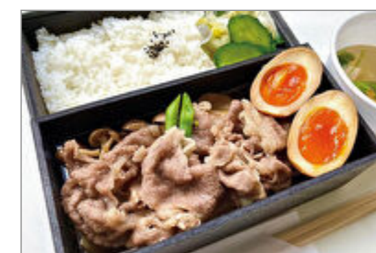
仙台牛すきやき弁当