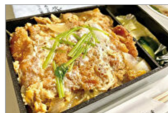
宮城野ポーク 割ソースのかつ重