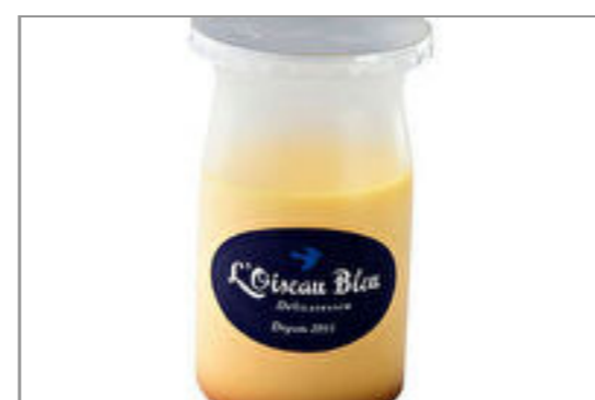
ロワゾブリュ特製プリン