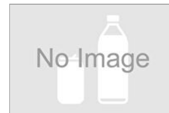
生茶(500ml ペットボトル)