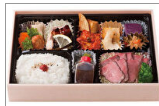
特上ローストビーフ弁当