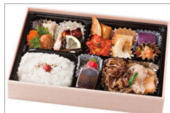
特上牛すき焼き弁当