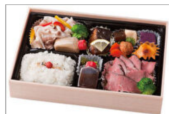
特上ローストビーフと三元豚冷しゃぶ弁当