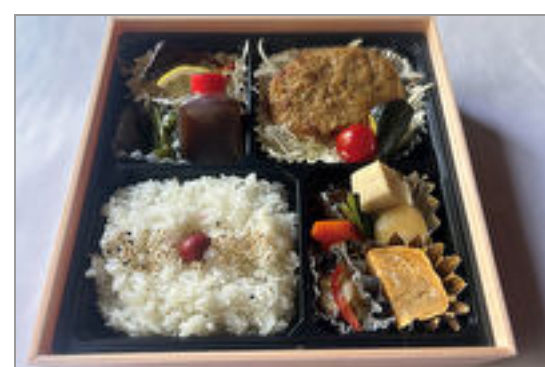
鹿児島県産黒豚の自家製ハンバーグ弁当

商品によっては、注文条件やオプション・サービス等がございますので、詳しくは WEB でご確認ください。