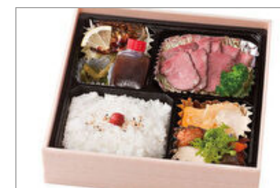
ローストビーフ弁当