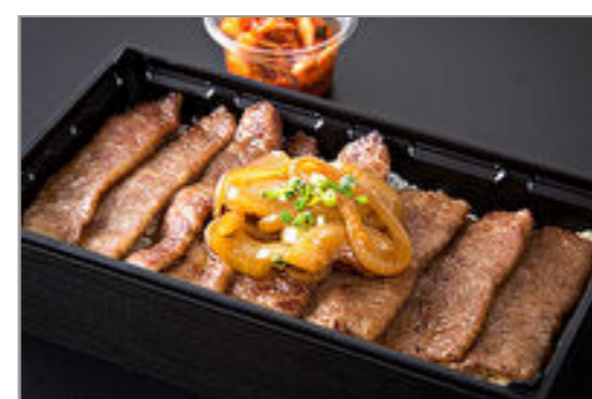
もうもう亭特選上カルビ弁 当