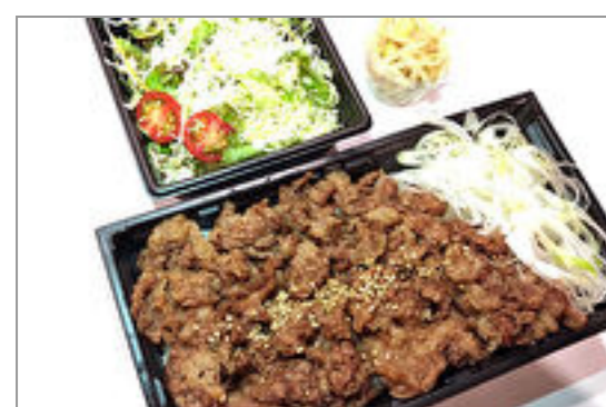
もうもう亭特選牛重