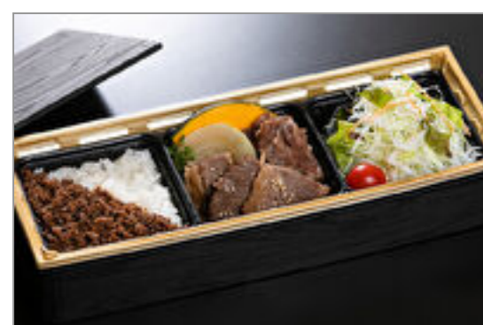
もうもう特製 焼肉・そば ろ飯弁当

商品によっては、注文条件やオプション・サービス等がございますので、詳しくは WEB でご確認ください。