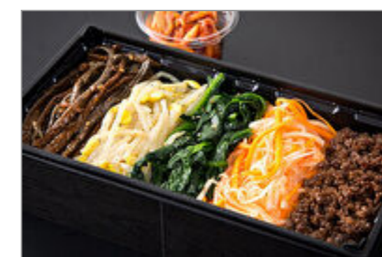
もうもう亭オリジナルビビ ンバ重