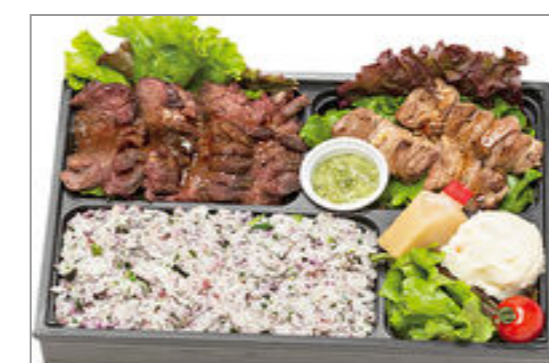
【VANDESCANO】極上牛ハラミステーキと豚ハラミ直火焼き弁当 1,797円(税込1,940円)／品番:ACHM039 お茶付き