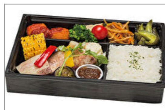
【REDBORN】アメリカンポークリブのローストBBQソース