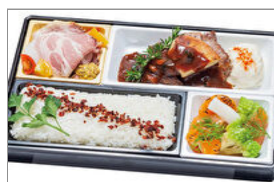
【グランクリュ】イベリコ豚の真空ローストとフォアグラハンブルグのトリュフペリゲー【Menu u C】 2,000円(税込2,160円)／品番:ACHM040 お茶付き