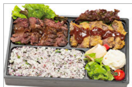
【VANDESCANO】極上牛ハラミステーキとピフカツの贅沢弁当 2,000円(税込2,160円)／品番:ACHM031 お茶付き