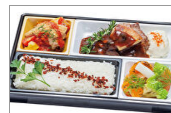
【グランクリュ】牛フィレ肉とフォアグラのロッキーニ・真鯛香草パン粉焼き【Menu A】 2,000円(税込2,160円)／品番:ACHM042 お茶付き