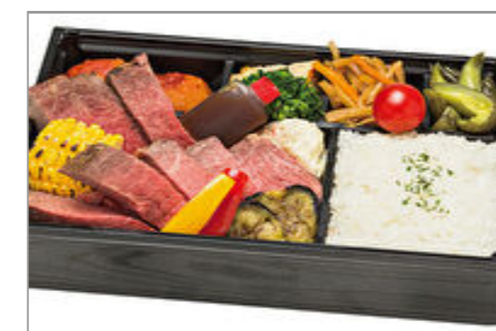
【REDBORN】和牛低温ローストのアメリカンステーキ(180g)