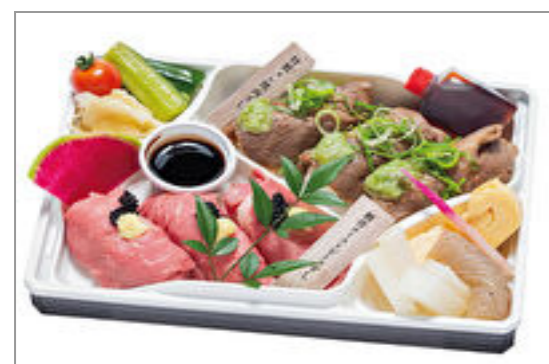
【肉ずしと酒肴 じゅげむ】創作ローストビーフと厳選牛焼肉の肉すし六貫盛り合わせ 1,621円(税込1,750円)／品番:ACHM029 お茶付き