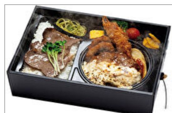
【神戸牛ハンバーグみやび亭】温まる!黒毛和牛焼肉、とろけるチーズハンバーグと有頭エビフライ弁当