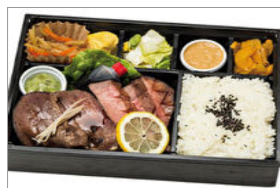
【ox tongue 3 7】仙台ロゼ牛タン二種盛り弁当