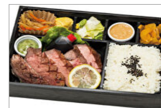
【ox tongue 3 7】仙台ロゼ牛タンの厚切り弁当