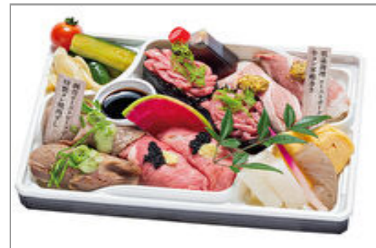
【肉ずしと酒肴 じゅげむ】じゅげむ特製 特上肉すし【四種八貫盛り合わせ】 2,000円(税込2,160円)／品番:ACHM026 お茶付き