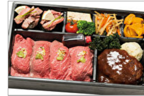
【REDBORN】黒毛和牛にぎりと牛タン軍艦・和牛ハンバーグ弁当 2,000円(税込2,160円)／品番:ACHM025 お茶付き