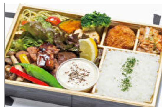
【ラクレット】黒毛和牛味噌炒めの洋食弁当～ラクレットチーズソース添え～