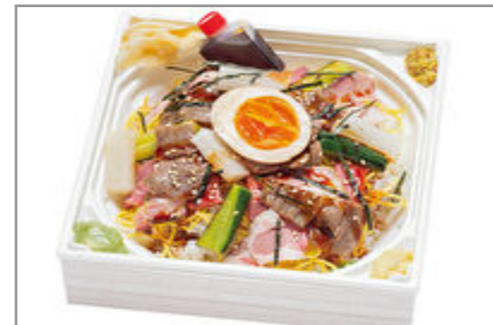
【肉ずしと酒肴 じゅげむ】3種のお肉を散りばめた肉珠ちらし寿司 1,797円(税込1,940円)／品番:ACHM027 お茶付き