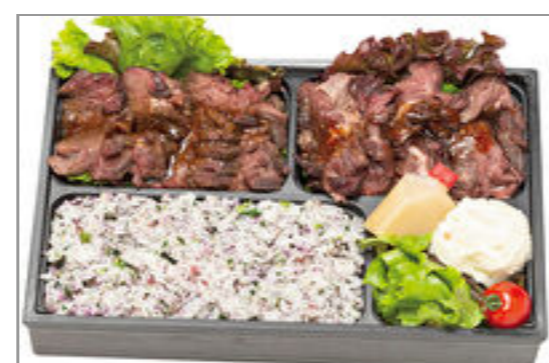
【VANDESCANO】【お肉2倍!】極上牛ハラミステーキの特製弁当 2,315円(税込2,500円)／品番:ACHM038 お茶付き