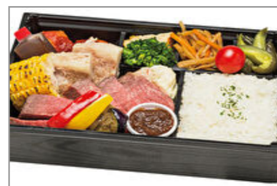
【REDBORN】和牛低温ローストのアメリカンステーキ(100g)とポークリブBBQソース