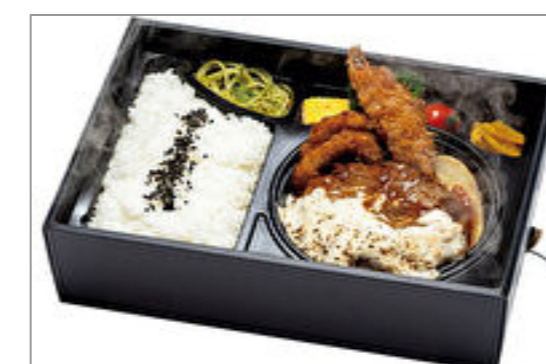
【神戸牛ハンバーグみやび亭】温まる!とろけるチーズハンバーグと有頭エビフライ弁当