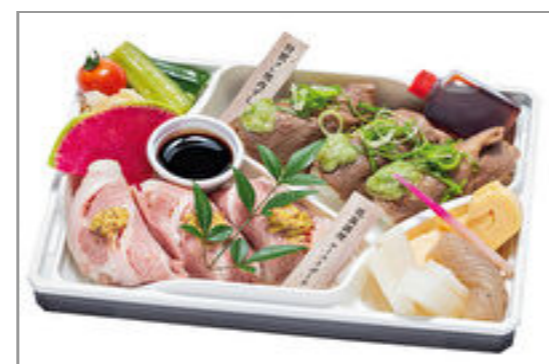
【肉ずしと酒肴 じゅげむ】厳選牛焼肉とロゼポークの肉すし六貫盛り合わせ 1,500円(税込1,620円)／品番:ACHM030 お茶付き