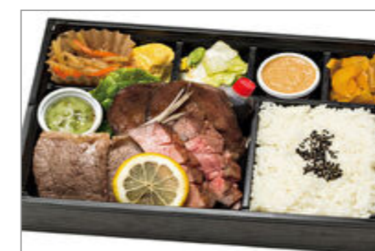
【ox tongue 3 7】仙台ロゼ牛タン食べ尽くし山賊弁当