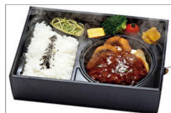
【神戸牛ハンバーグみやび亭】温まる!ハンバーグ弁当 香り高いデミグラスソース