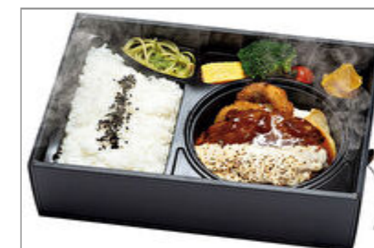
【神戸牛ハンバーグ みやび亭】温まる!ハンバーグ弁当 とろけるチーズデミグラスソース