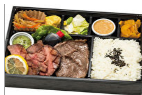
【ox tongue 37】和牛焼肉と仙台ロゼ牛タンの厚切り弁当