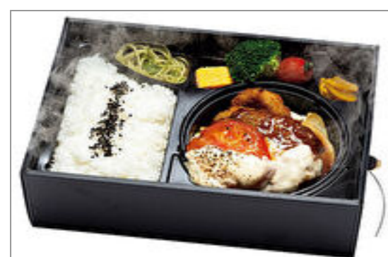
【神戸牛ハンバーグみやび亭】温まる!ハンバーグ弁当 トマトとチーズのディアボラ風