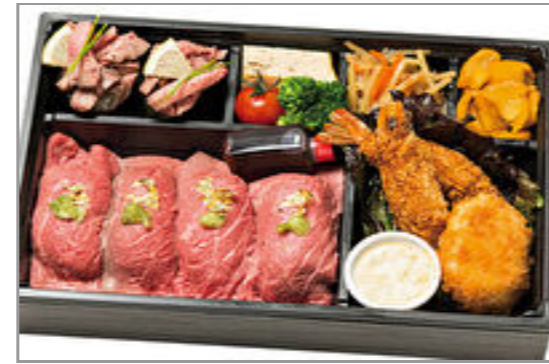
【REDBORN】黒毛和牛にぎりと牛タン軍艦・ミックスフライ弁当 2,000円(税込2,160円)／品番:ACHM024 お茶付き