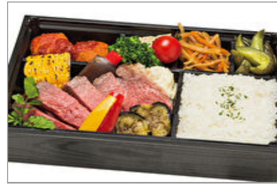
【REDBORN】和牛低温ローストのアメリカンステーキ(100g) 2,000円(税込2,160円)／品番:ACHM023 お茶付き