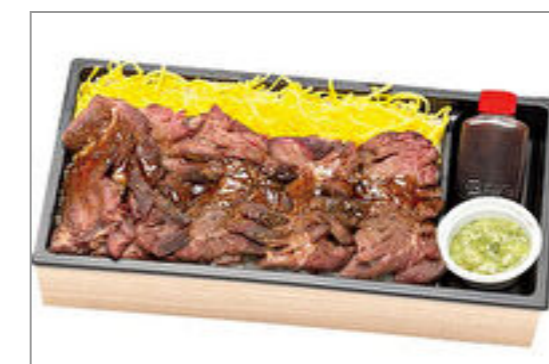
【VANDESCANO】牛ハラミステーキ重 1,500円(税込1,620円)／品番:ACHM014 お茶付き