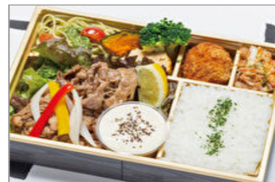
【ラクレット】牛肉チーズダッカルビの洋食弁当～ラクレットチーズソース添え～