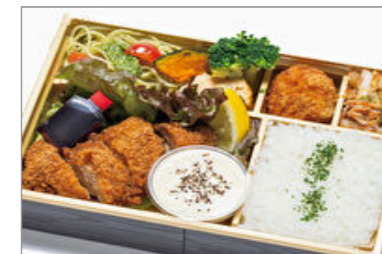
【ラクレット】チキンカツの洋食弁当～ラクレットチーズソース添え～