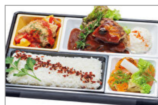
【グランクリュ】フォアグラハンブルグのトリュフペリゲー・真鯛香草パン粉焼き【Menu B】 1,797円(税込1,940円)／品番:ACHM041 お茶付き