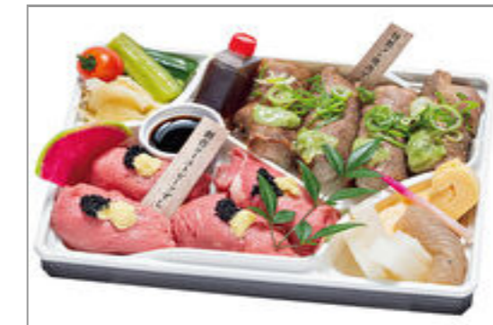
【肉ずしと酒肴 じゅげむ】厳選牛焼肉と創作ローストビーフの肉すし八貫盛り合わせ 1,797円(税込1,940円)／品番:ACHM028 お茶付き