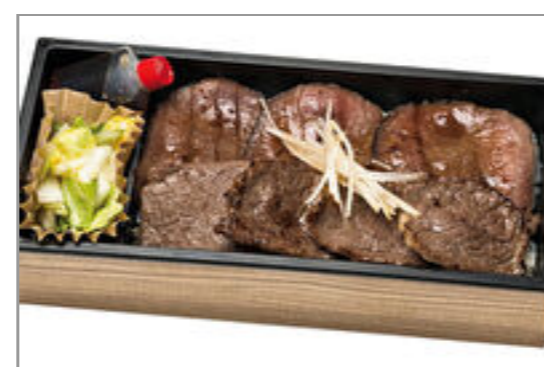
【ox tongue 3 7】仙台うす切り牛タンと和牛焼肉重