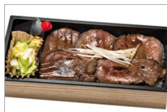
【ox tongue 3 7】仙台うす切り牛タン重

商品によっては、注文条件やオプション・サービス等がございますので、詳しくはWEBでご確認ください。