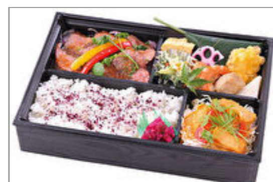
飛騨牛ステーキ弁当