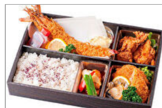
ミックスフライ弁当