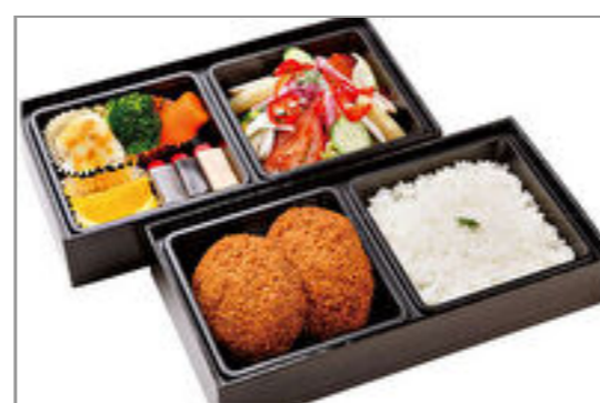
香味屋特製スペシャルメンチカツ弁当