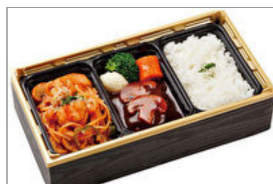
香味屋特製ミニハンバーグとナポリタン弁当