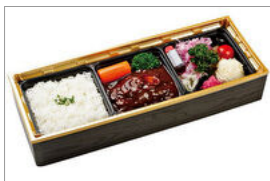
香味屋特製ハンバーグ弁当