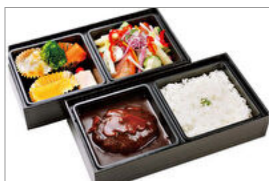
香味屋特製スペシャルハンバーグ弁当