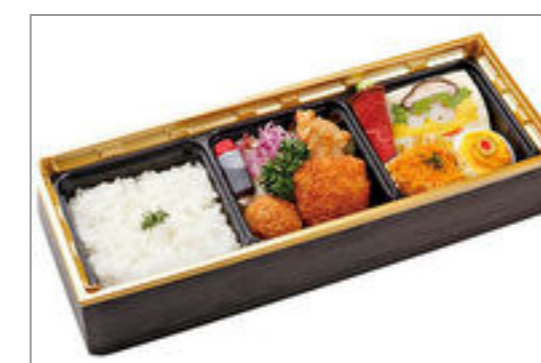
香味屋特製洋食弁当