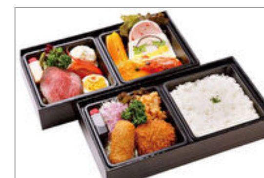
スペシャル洋食弁当A