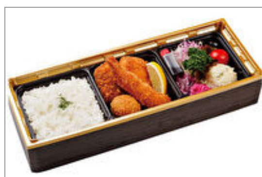
香味屋特製ミックスフライ弁当

商品によっては、注文条件やオプション・サービス等がございますので、詳しくは WEB でご確認ください。