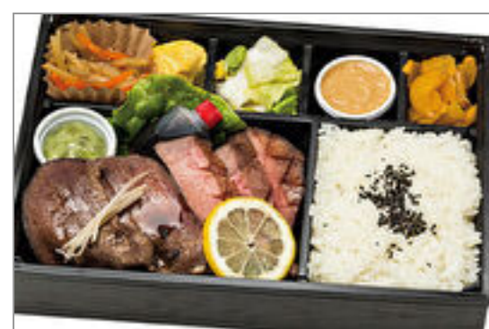
仙台ロゼ牛タン二種盛り弁当

商品によっては、注文条件やオプション・サービス等がございますので、詳しくは WEB でご確認ください。