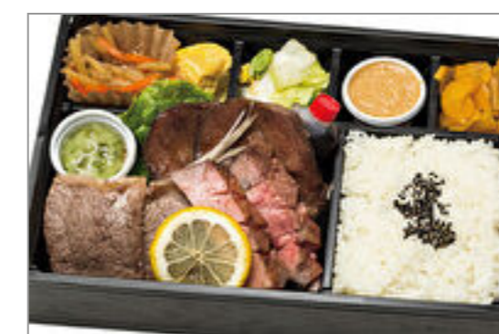
仙台ロゼ牛タン食べ尽くし山賊弁当