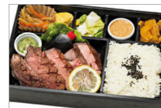
仙台ロゼ牛タンの厚切り弁当