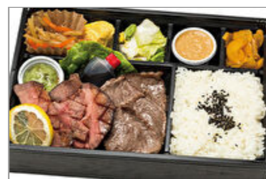
和牛焼肉と仙台ロゼ牛タンの厚切り弁当