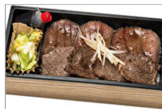
仙台うす切り牛タンと和牛焼肉重