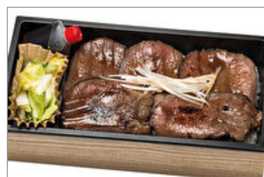
仙台うす切り牛タン重