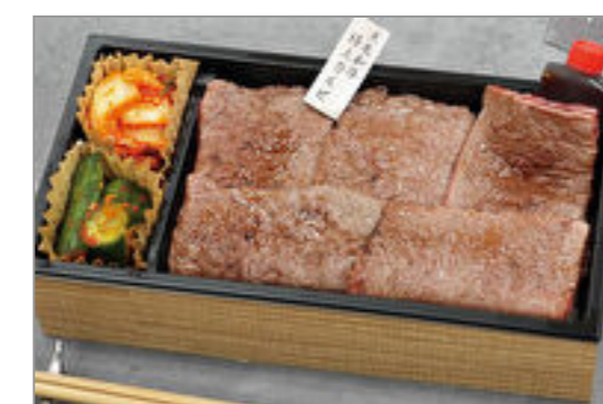
特選 黒毛和牛の焼肉重