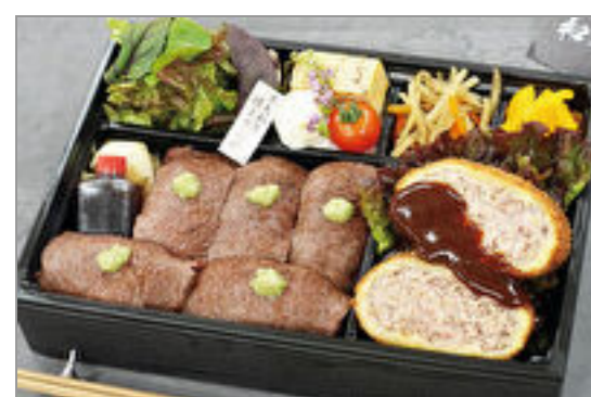
特撰 黒毛和牛にぎりと和牛ミンチカツ弁当