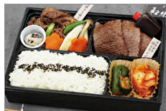
特撰 黒毛和牛焼肉とすき焼き弁当(タレ)