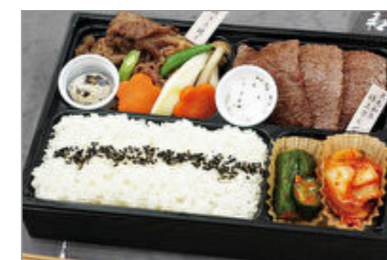
特撰 黒毛和牛焼肉とすき焼き弁当(トリュフ塩)