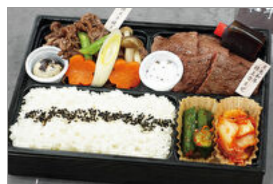
特撰 黒毛和牛焼肉とすき焼き弁当(お肉増量)

商品によっては、注文条件やオプション・サービス等がございますので、詳しくは WEB でご確認ください。