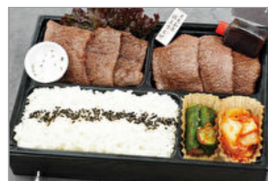
謹製 黒毛和牛弁当