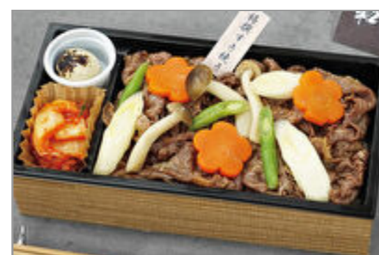
特選 黒毛和牛のすき焼き重