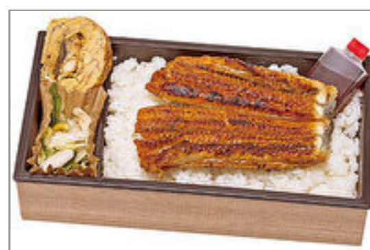
鰻巻き入り うなぎ弁当(漬物付き)