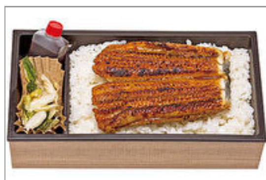
うなぎ弁当(漬物付き)