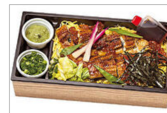
うな膳のひつまぶし風(薬味付き)