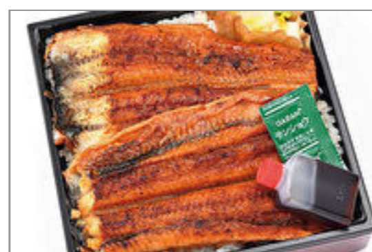
特上うな重(漬物付き)