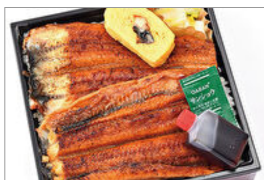
鰻巻き入り 特上うな重(漬物付き)

商品によっては、注文条件やオプション・サービス等がございますので、詳しくは WEB でご確認ください。