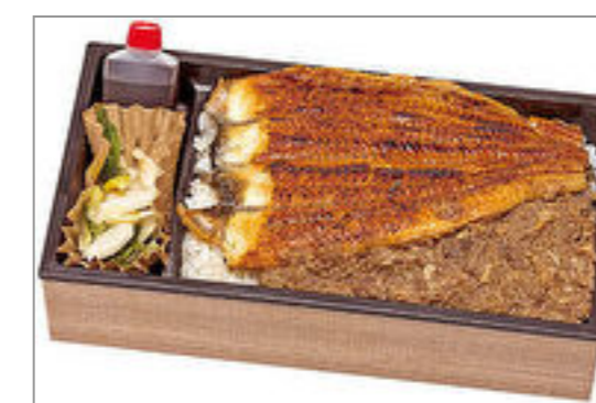
うなぎと和牛しぐれ弁当(漬物付き)