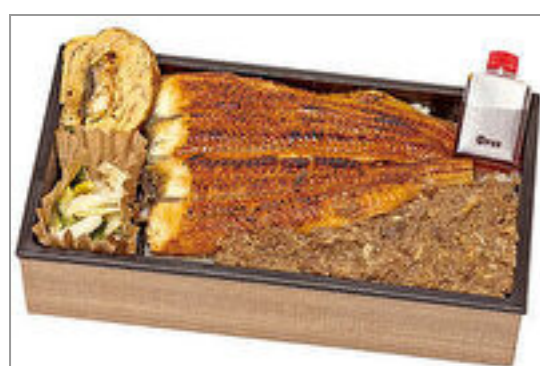
鰻巻き入り うなぎと和牛しぐれ弁当(漬物付き)