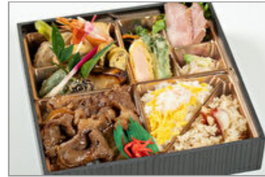
すき焼き幕の内弁当 2,000円(税込2,160円) / 品番: TGAL011