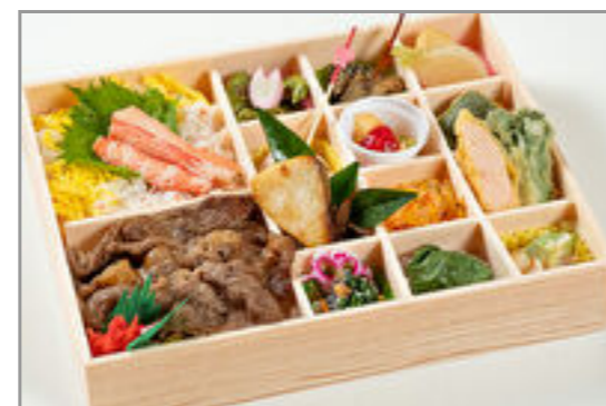
蟹とすき焼きの彩り弁当