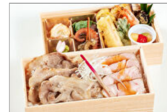
とちぎゆめポーク弁当