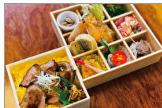
利月-ゆめポークのトンテキー (りつき)

商品によっては、注文条件やオプション・サービス等がございますので、詳しくはWEBでご確認ください。