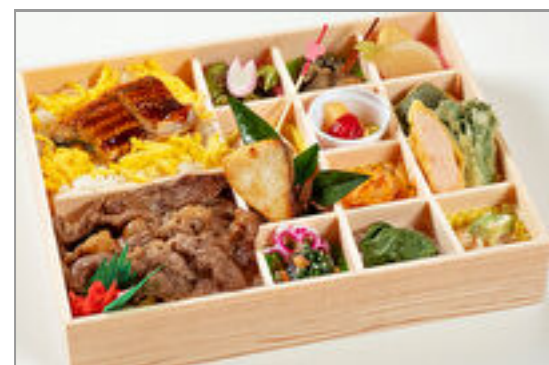
すき焼きとうなぎの彩り弁当