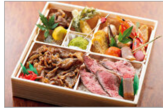
すき焼き・ステーキW御膳 2,100円(税込2,268円) / 品番: TGAL010