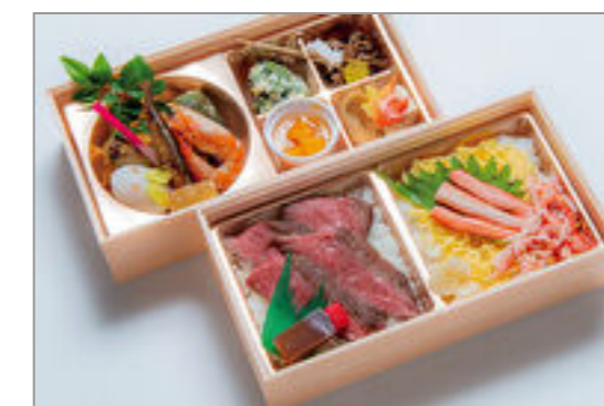
ステーキと蟹ちらしの二段弁当