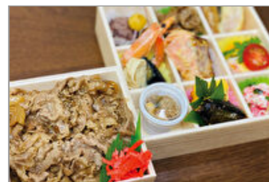
利月-すき焼きご飯 (りつき)