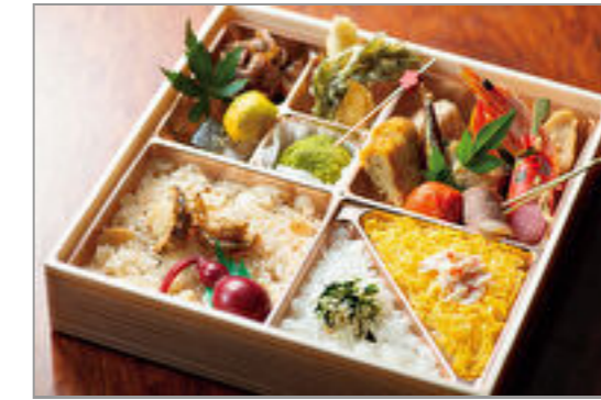
幕の内弁当 1,500円(税込1,620円) / 品番: TGAL012