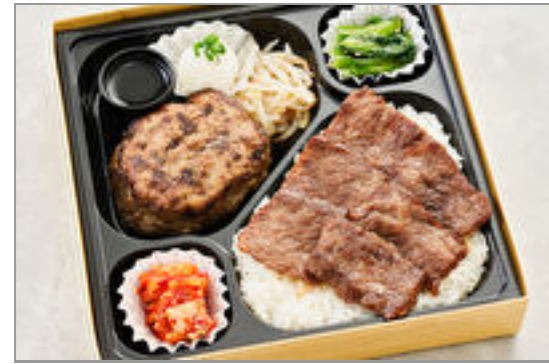
将泰庵の和牛ハンバーグと上カルビ弁当 2,945円(税込3,180円) / 品番:TKKP033