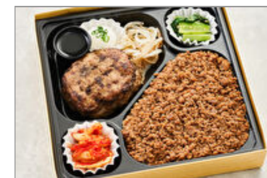
将泰庵の和牛ハンバーグと牛そぼろ弁当