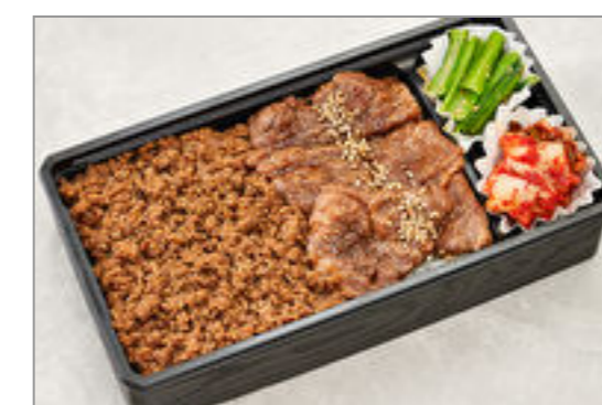
牛カルビと牛そぼろ弁当