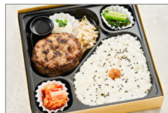
将泰庵の和牛ハンバーグ弁当