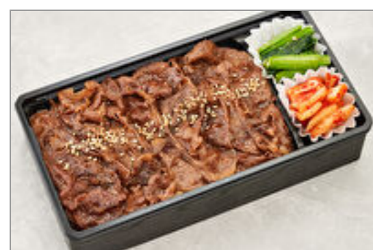
薄切りカルビ弁当