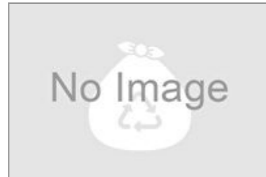
ごみ袋(45L) 28円(税込30円) / 品番:TKKP1003