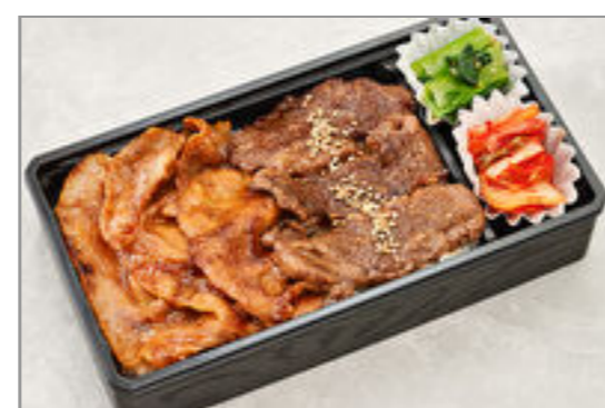
牛カルビと多幸豚弁当