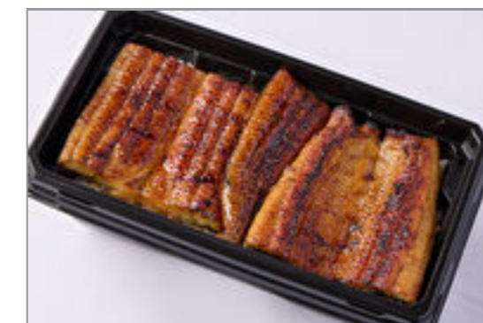
【温まる】築地うなぎ重『極』