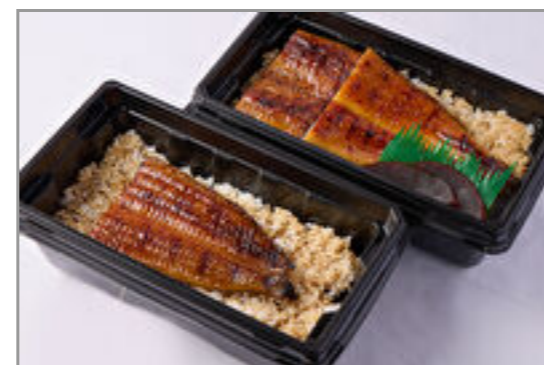
【温まる】築地うなぎ重『特選』