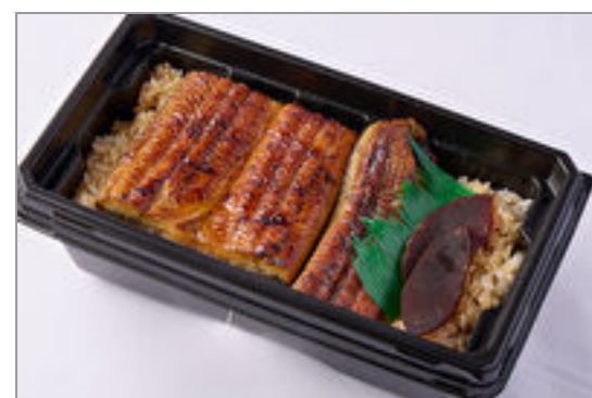
【温まる】築地うなぎ重『舞』