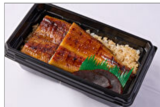
【温まる】築地うなぎ重『葵』