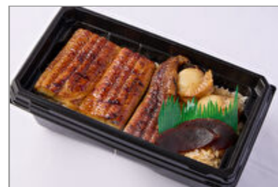
【温まる】築地うなぎ重『彩』