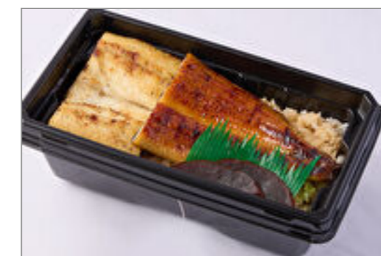
【温まる】築地うなぎ重『白蒲葵』