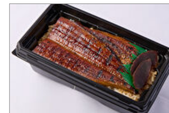
【温まる】築地うなぎ重『雅』