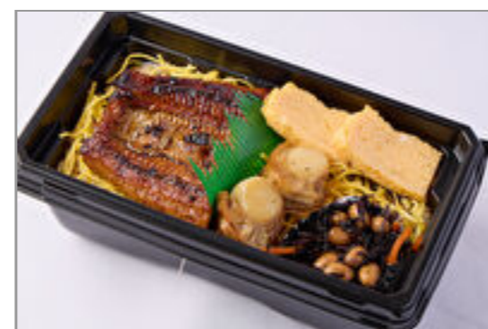
【温まる】築地うなぎ食堂『選べる定食』