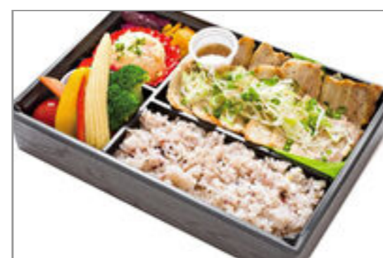
特選豚カルビのネギ塩ソースと季節の彩り野菜弁当