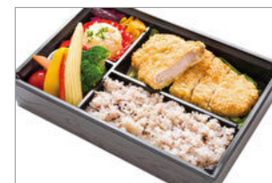
牛かつと季節の彩り野菜弁当