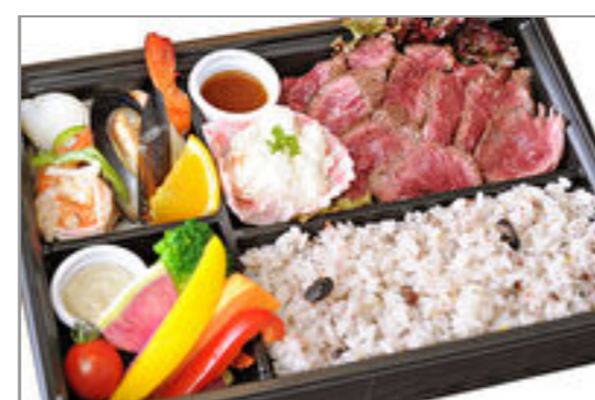
牛サガリステーキとシーフード弁当