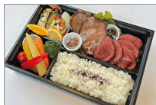
牛タンと特選牛ステーキとシーフードの贅沢弁当

商品によっては、注文条件やオプション・サービス等がございますので、詳しくは WEB でご確認ください。