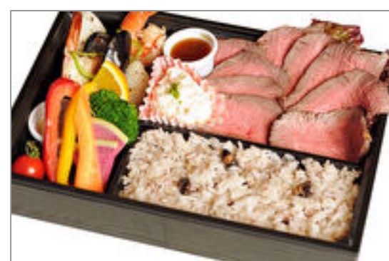
大麦牛ローストビーフとシーフード弁当