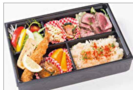
季節の食材のロースビーフ弁当

商品によっては、注文条件やオプション・サービス等がございますので、詳しくはWEBでご確認ください。