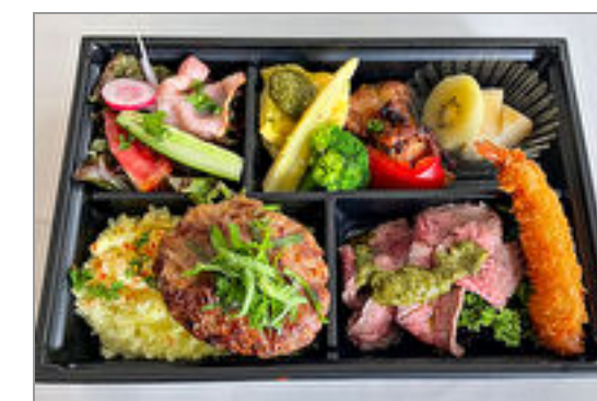
常陸牛使用ハンバーグとロースビーフのコンビ弁当