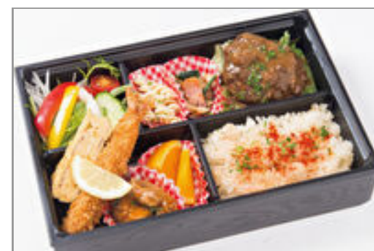
常陸牛使用ハンバーグ弁当