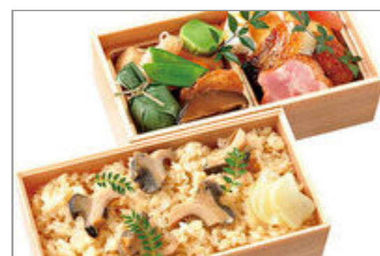
帆立の炊き込み二段弁当