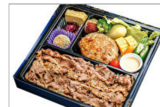
厳選牛炙り焼きとデミハンバーグ御膳