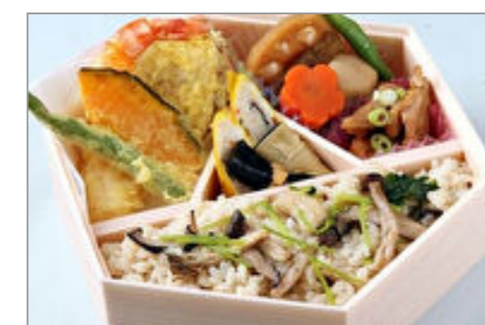
季節の釜めし天婦羅御膳