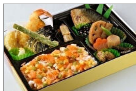
寿司松花堂 海 ~うみ~