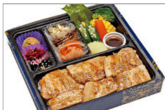
三元豚カルビ御膳