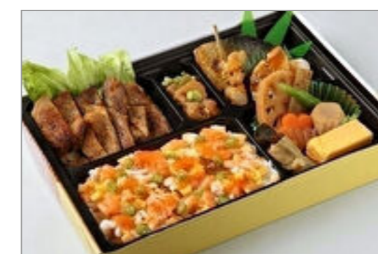
寿司松花堂 空 ~そら~