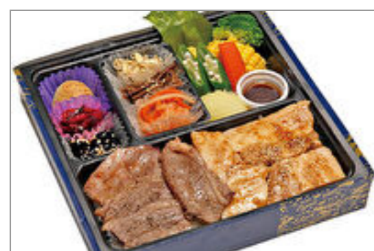
黒毛和牛と三元豚カルビ御膳