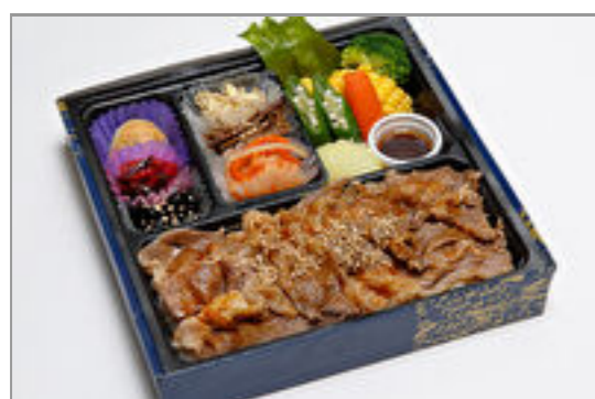
厳選牛焼きしゃぶ御膳