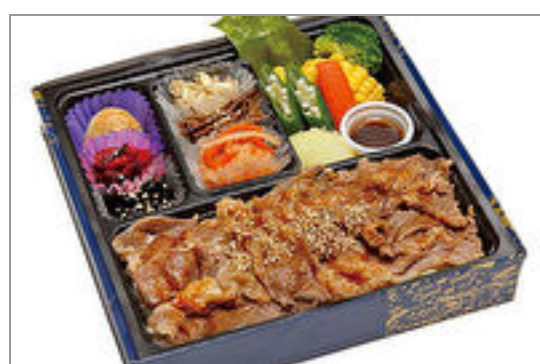
国産牛焼きしゃぶ御膳