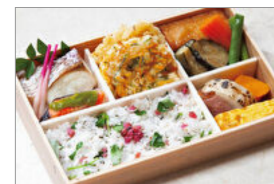
旬の焼き魚・・・シラスと梅の和弁当