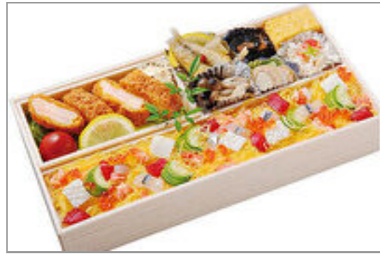
京風バラちらし・エビカツ御膳(通常)