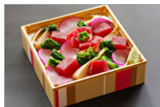
『春々』マグロと春野菜のチラシ寿司

商品によっては、注文条件やオプション・サービス等がございますので、詳しくは WEB でご確認ください。