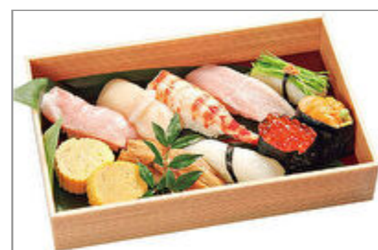
お奨め!! にぎり寿司(季節のにぎり寿司)