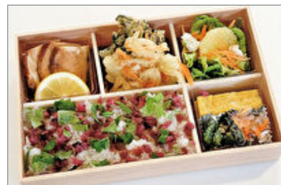
洋風鶏の照り焼き弁当