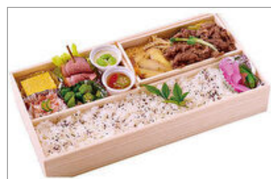
すき焼き弁当(通常)