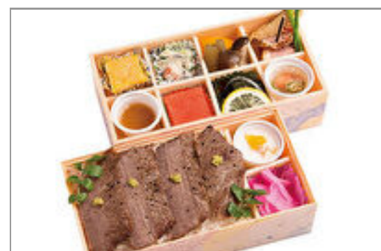
さくら和牛ステーキ2段(黒毛和牛ステーキ)