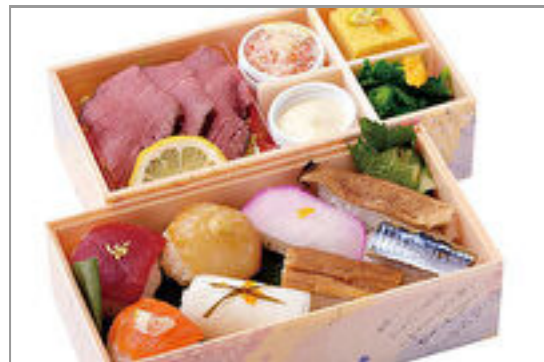
新・手まり弁当(通常)