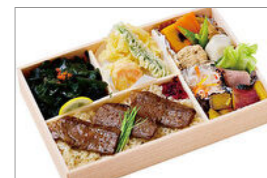
和牛ステーキ幕の内弁当