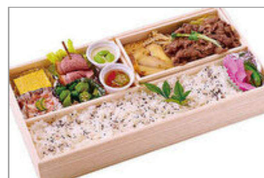
スペシャルすき焼き弁当