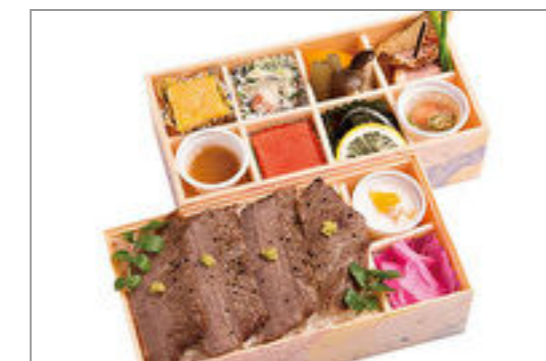
さくら和牛ステーキ2段(和牛ステーキ)