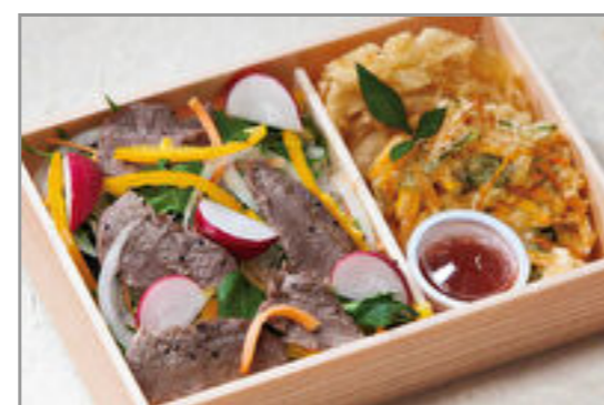
和牛ステーキサラダ膳