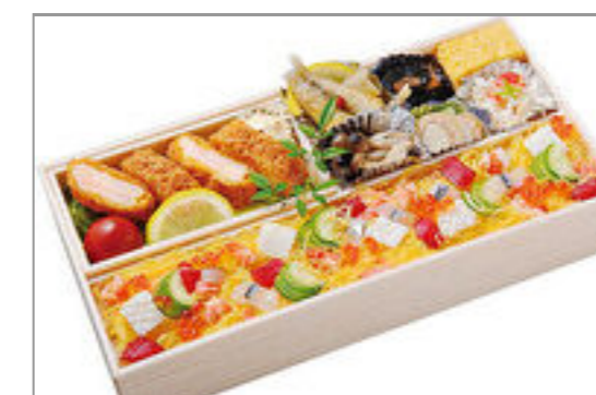
京風バラちらし・エビカツ御膳(ミニサイズ)