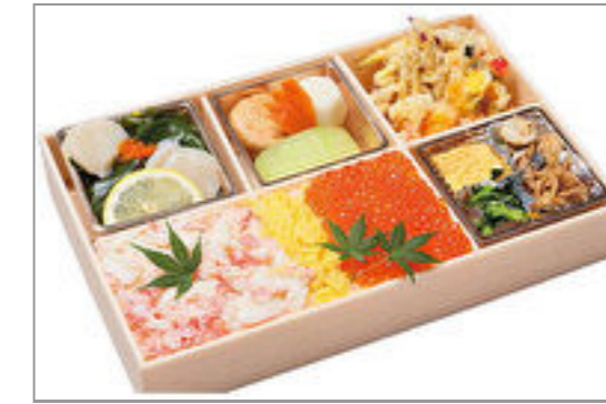
贅沢!!カニとイクラのスペシャル弁当(カニとイクラver.)