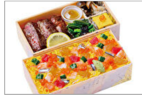
和牛ステーキ姫ちらし2段重