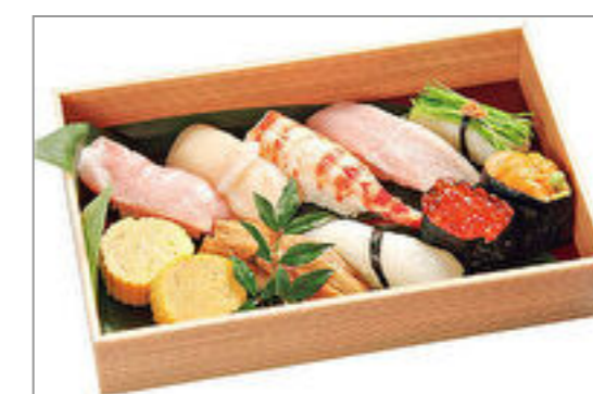
お奨め!! にぎり寿司(通常)