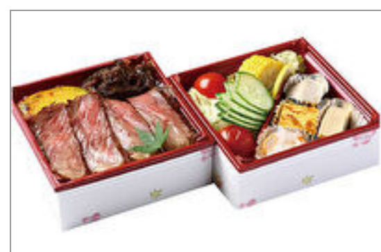
柔らか黒毛和牛ステーキ重