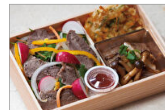
和牛ステーキサラダ膳(マグロステーキ入り)