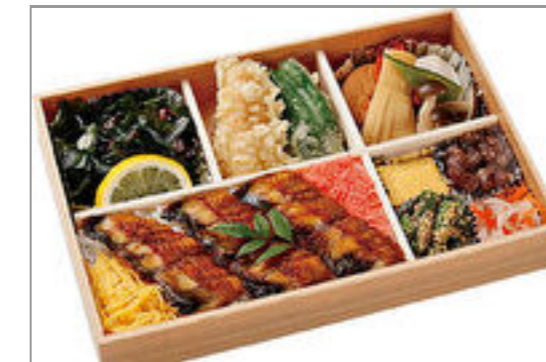
春夏秋冬お魚弁当