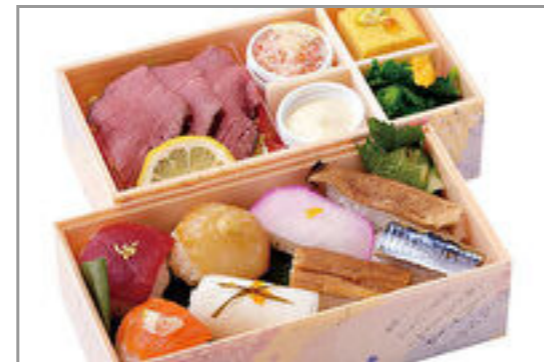
新・手まり弁当(ふぐ手まり寿司入り)