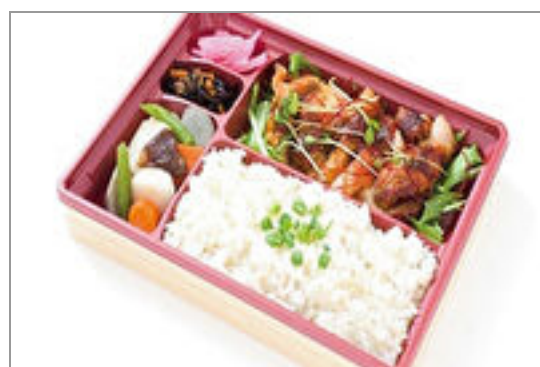
喜佑の鯖ごはん弁当～鶏の辛みそ焼き～

商品によっては、注文条件やオプション・サービス等がございますので、詳しくはWEBでご確認ください。