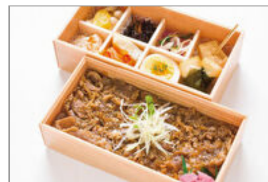
喜佑の和風御膳(牛しぐれ煮)