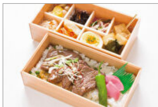
喜佑の和風御膳(イチボの炙りステーキ)