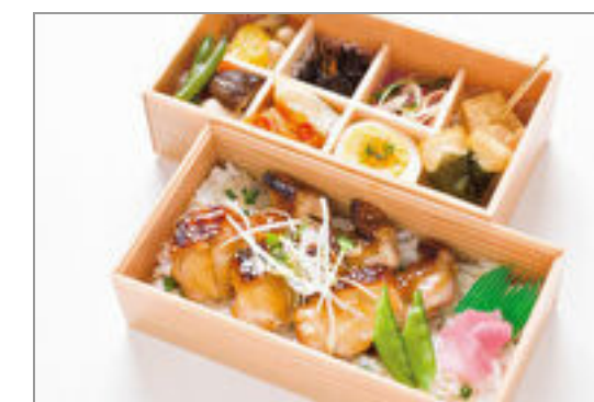
喜佑の和風御膳～低温調理した鶏の照り焼き～