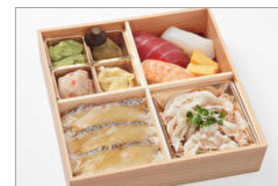
鯛の漬け丼と魚河岸握り