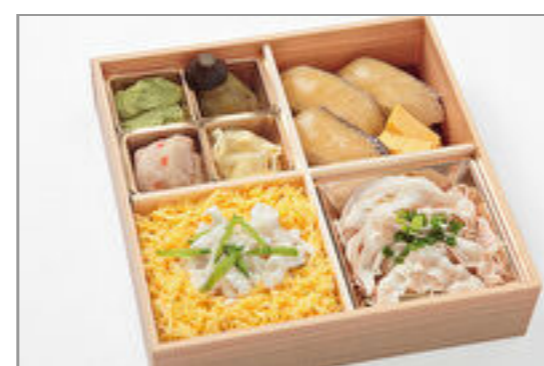
鯛めしと活〆鯛の漬け握り