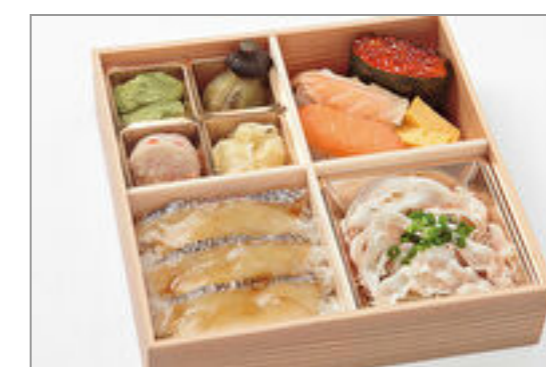
活〆鯛の漬け丼とサーモン3種握り