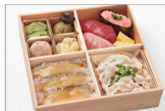
活〆鯛の漬け丼とまぐろ3種握り