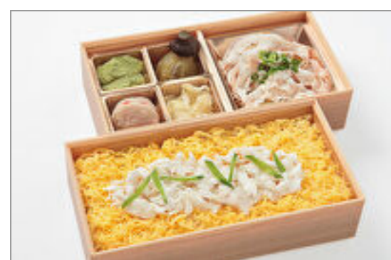
彩り鯛めしの2段重