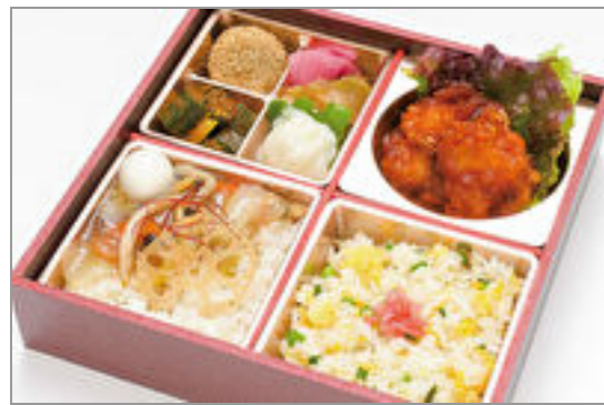
琳の中華三昧 ~特製ソースのエビチリ~

商品によっては、注文条件やオプション・サービス等がございますので、詳しくは WEB でご確認ください。