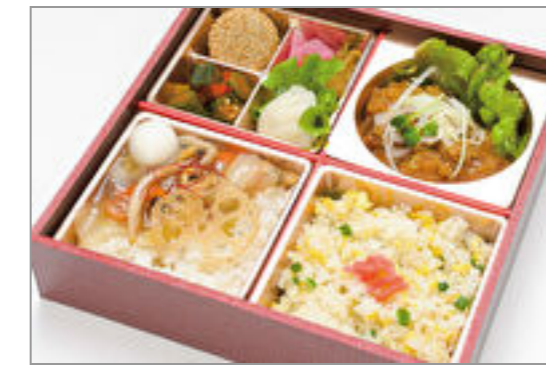
琳の中華三昧 ~香味ダレの油淋鶏~