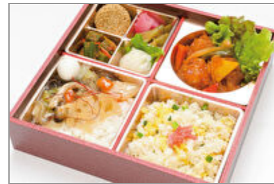
琳の中華三昧 ~黒酢の酢豚~