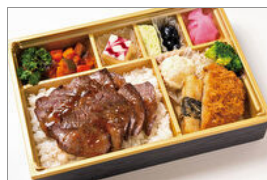
A-4ランク以上米沢牛『 極上ステーキ』膳

商品によっては、注文条件やオプション・サービス等がございますので、詳しくは WEB でご確認ください。