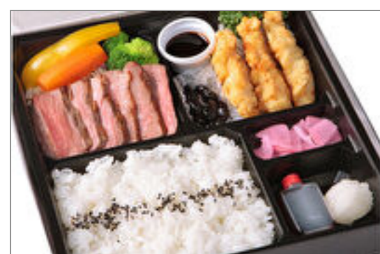
厳選とちぎ和牛ステーキ&大分風とり天膳