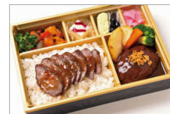
A-4ランク以上米沢牛ス テーキ&自家製煮込みハン バーグ膳