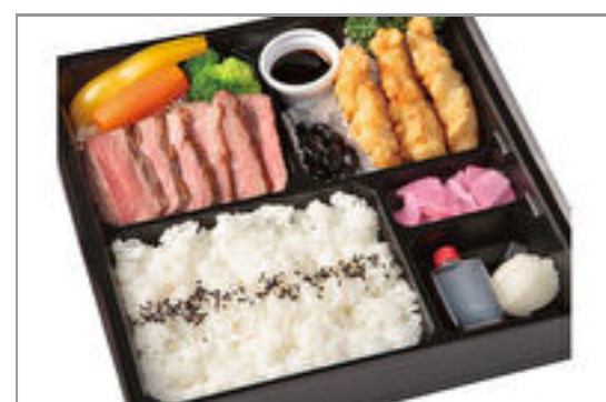
厳選とちぎ和牛ステーキ&大分風とり天膳