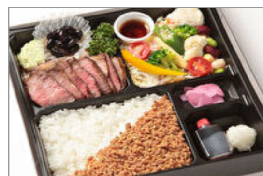
山形牛ステーキ&サラダ膳