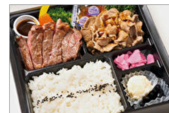
US産牛サーロイン&ポー クジンジャー膳