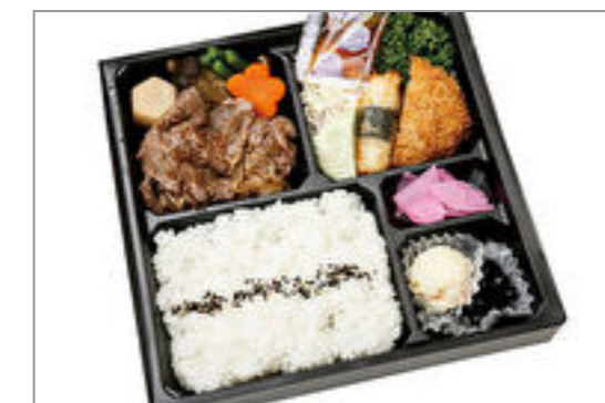
山形牛すき焼き膳