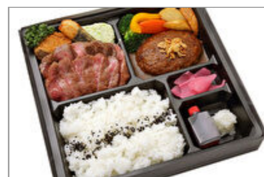
飛騨膳 旬『極膳』【飛騨牛コロツケ添え】