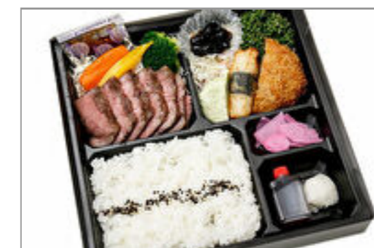
山形牛ステーキ膳