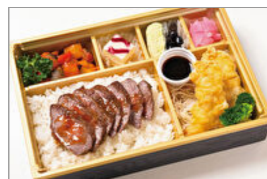
A-4ランク以上米沢牛ス テーキ&大分風とり天膳