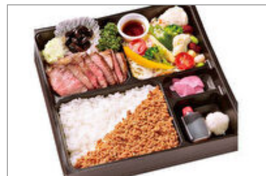
とちぎ和牛ステーキ&サラダ膳