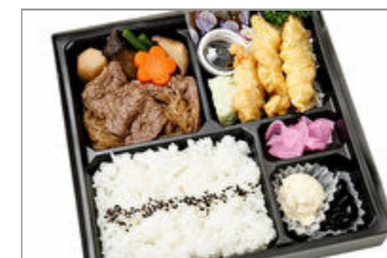
山形牛すき焼き&大分風と り天膳