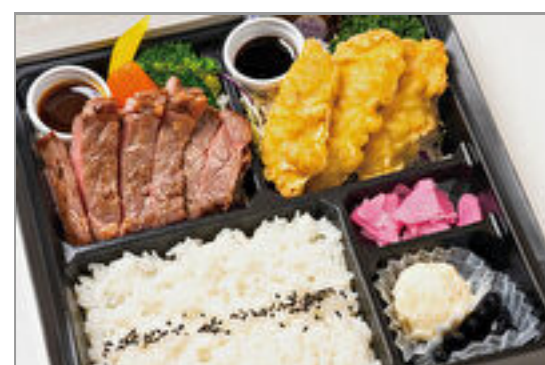
牛サーロイン&大分風とり 天膳