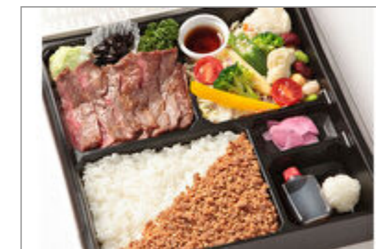
国産牛サーロイン&サラダ膳