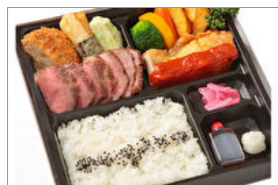
飛騨牛ステーキとチキンのトマトソース