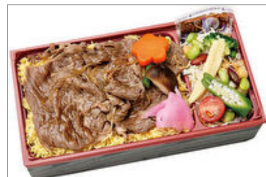
山形牛のすき焼き重