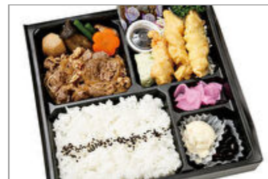
すき焼き&大分風とり天膳