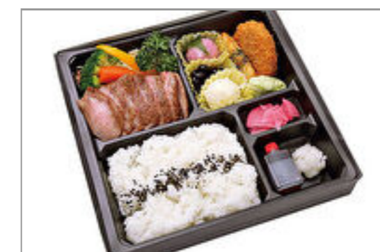
飛騨牛ステーキ膳【飛騨牛コロッケ添え】