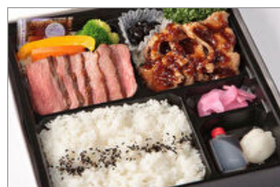
山形牛ステーキ&ポークジンジャー膳