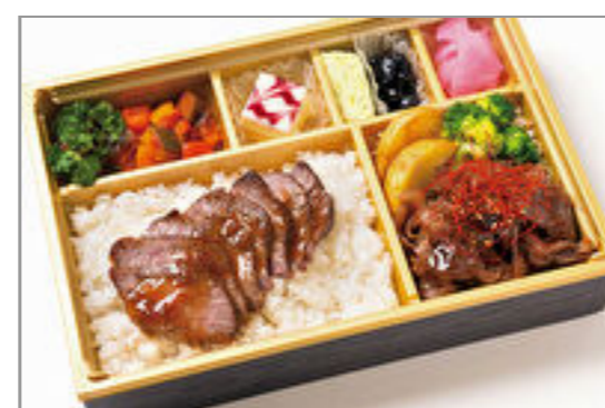
A-4ランク以上米沢牛ス テーキ&山形牛焼きしゃぶ 膳