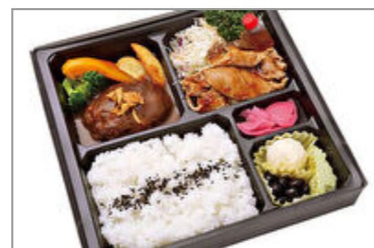
自家製煮込みハンバーグ膳