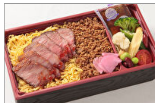
とちぎ和牛ステーキ重