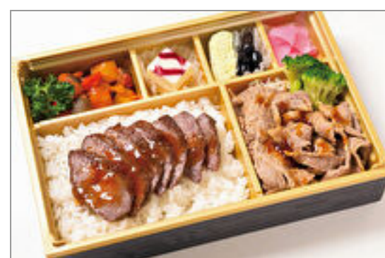
A-4ランク以上米沢牛ス テーキ&ポークジンジャー 膳