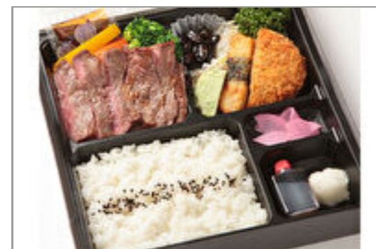
国産牛サーロインステーキ膳