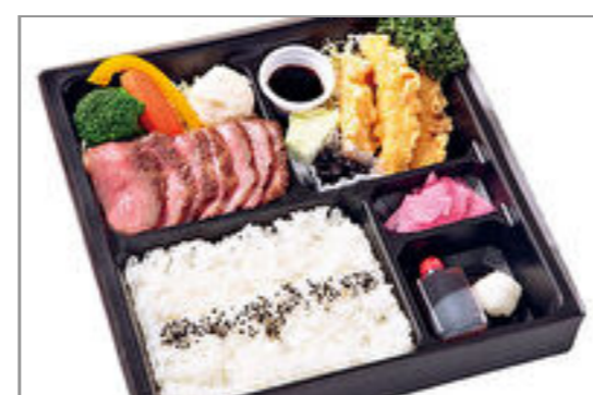
飛騨牛ステーキ&大分風とり天膳