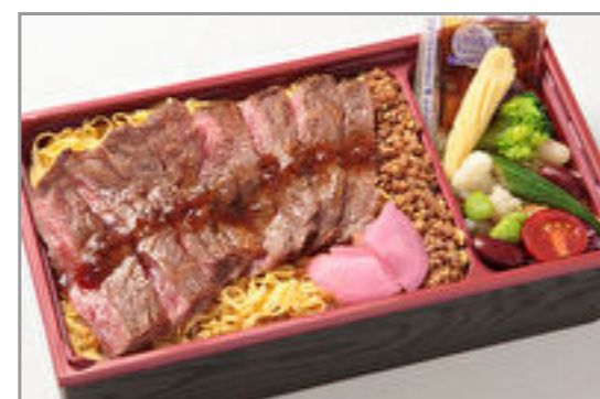
国産牛サーロイン重