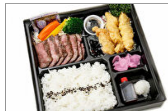
山形牛ステーキ&大分風とり天膳