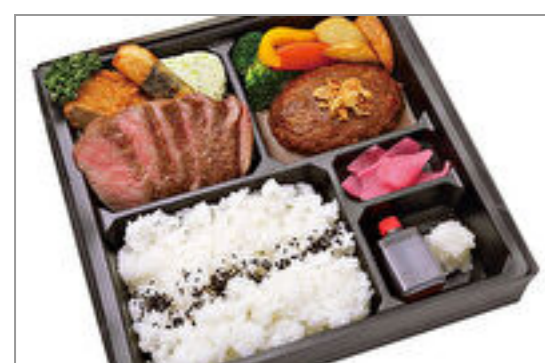
飛騨牛ステーキ&自家製煮込みハンバーグ膳【飛騨牛コロッケ添え】