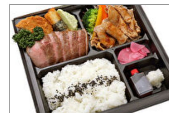
飛騨牛ステーキ&ポークジンジャー膳【飛騨牛コロツケ添え】