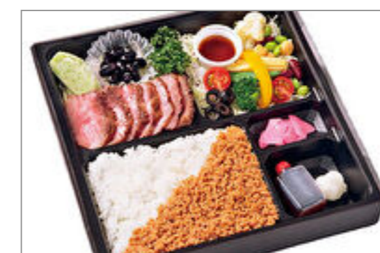
飛騨牛ステーキ&サラダ膳