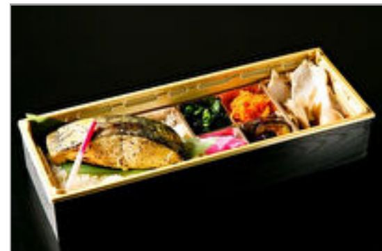
鱈の西京焼き和御膳