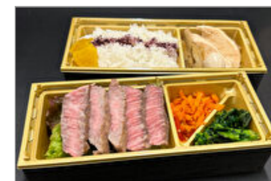
A5黒毛和牛イチ波士ステーキ2段重