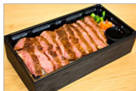
お肉増量! 葡萄牛ステーキ重