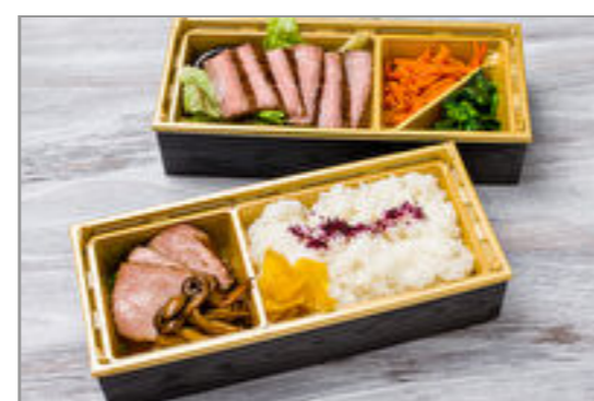
A5黒毛和牛ステーキ&A5ローストビーフ2段重