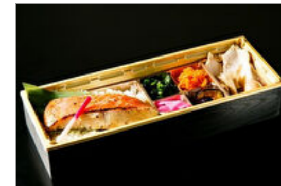
金目鯛の西京焼き和御膳