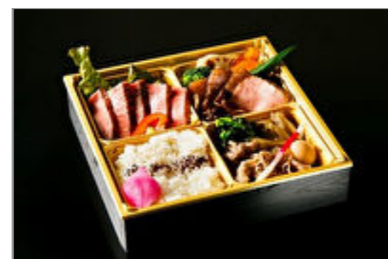
ステーキ・すき焼き・ローストビーフ A5黒毛和牛「九州王」満喫御膳