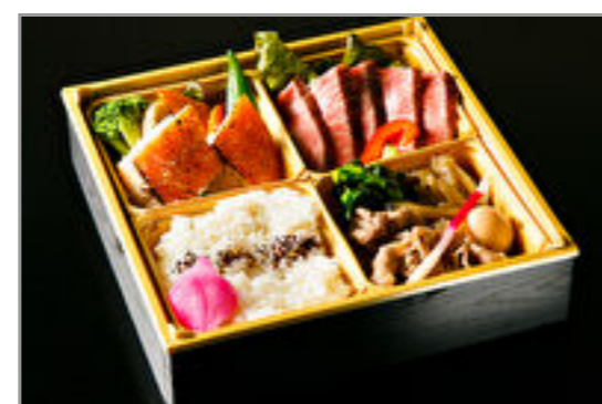
A5黒毛和牛イチ波士ステーキと金目鯛御膳