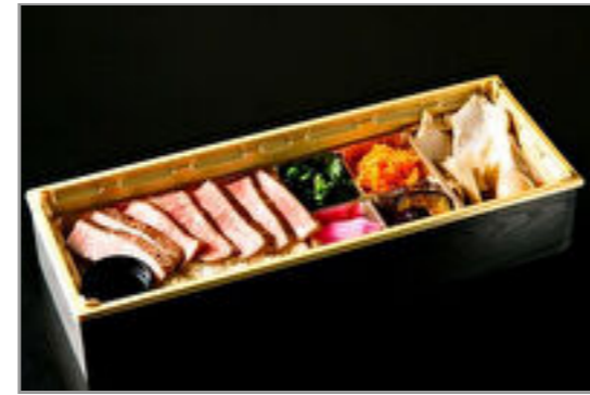
【お肉増量】A5黒毛和牛イチボステーキの和風御膳