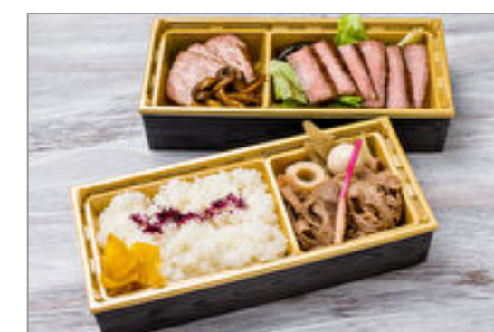
A5黒毛和牛「九州王」2段重