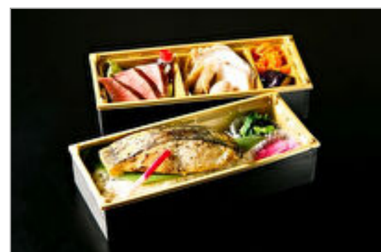
鱈の西京焼きとA5黒毛和牛イチボステーキの2段重