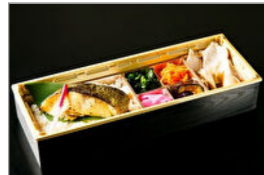
銀だらの西京焼き和御膳