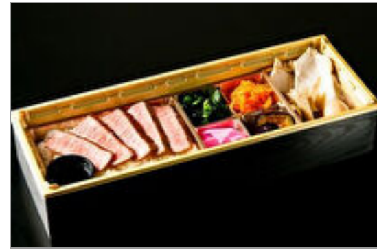
A5黒毛和牛イチボステーキの和風御膳