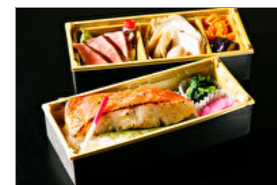
金目鯛の西京焼きとA5黒毛和牛イチ波士ステーキの2段重