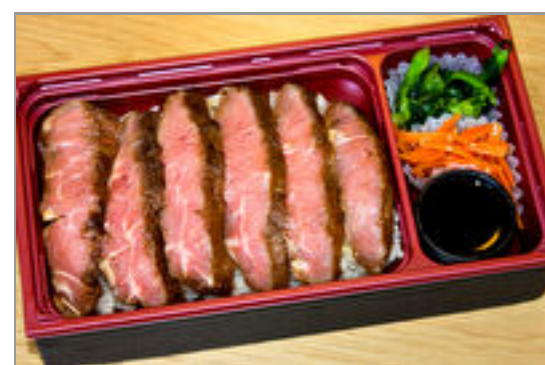
葡萄牛ステーキ重