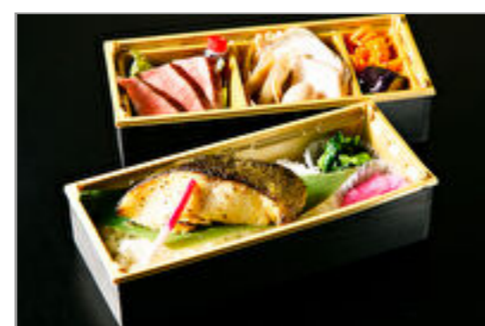
銀だらの西京焼きとA5黒毛和牛イチ波士ステーキの2段重