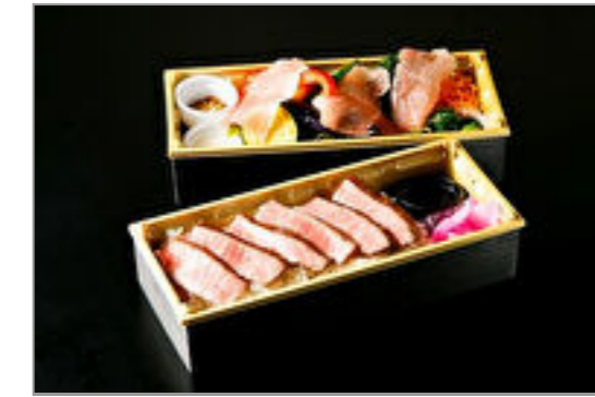
A5黒毛和牛ステーキ重&季節野菜と生ハムサラダ2段重