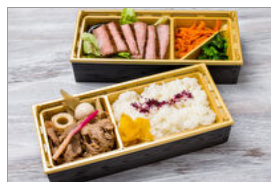
A5黒毛和牛ステーキ&A5すき焼き2段重

商品によっては、注文条件やオプション・サービス等がございますので、詳しくは WEB でご確認ください。