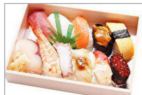
特上握りの盛り合わせ