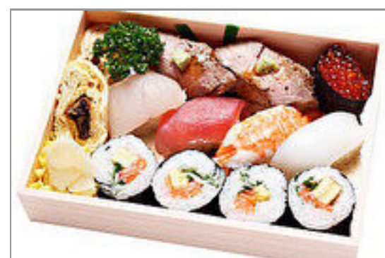
侑希特製いродり寿司