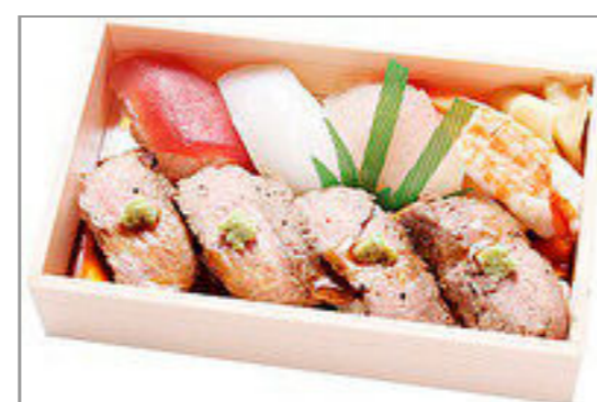
侑希の海鮮&肉寿司