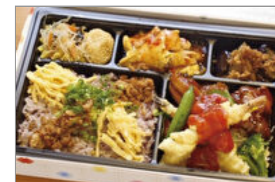
五穀米そぼろご飯と海老チリの中華づくし弁当 1,500円(税込1,620円) / 品番:KKDB014 お茶付き