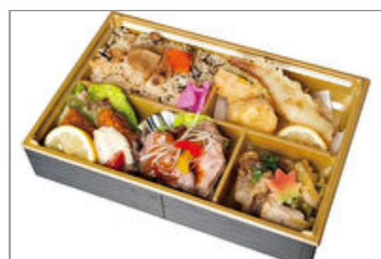
瀬戸内産牡蠣フライとすき焼きの芳醇弁当