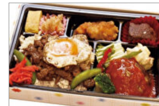
炙り壺漬けハラミとハンバーグコンビ目玉焼き添え弁当 1,500円(税込1,620円) / 品番:KKDB011 お茶付き