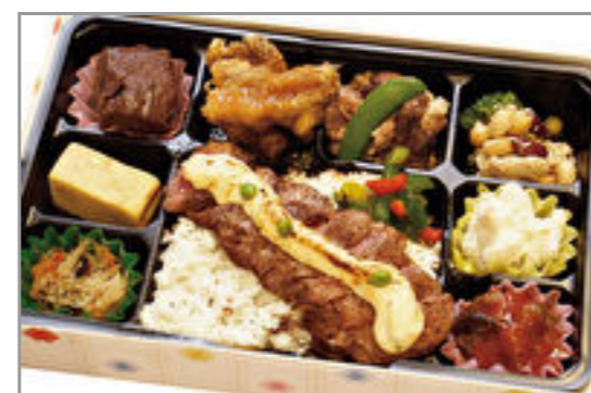
贅沢ジューシーステーキ弁当 2,000円(税込2,160円) / 品番:KKDB013 お茶付き