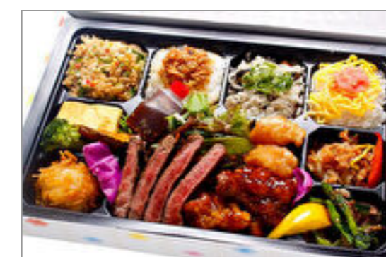
カラフル桃香ご膳 2,000円(税込2,160円) / 品番:KKDB017 お茶付き