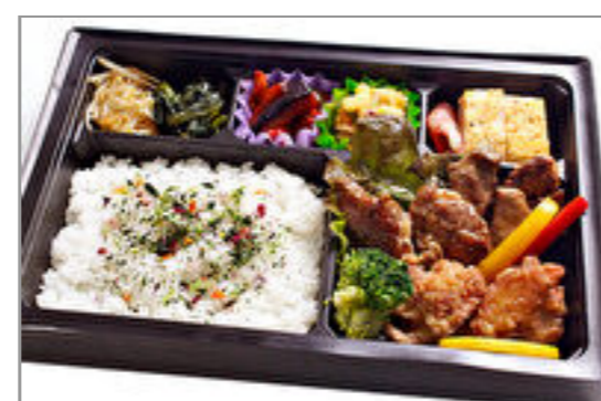
岡山和牛ハラミと地鶏唐揚げのコンビ弁当 1,500円(税込1,620円) / 品番:KKDB020 お茶付き