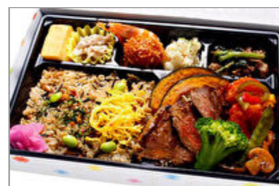
有機野菜と中華風熟成牛のコラボ弁当 1,500円(税込1,620円) / 品番:KKDB016 お茶付き