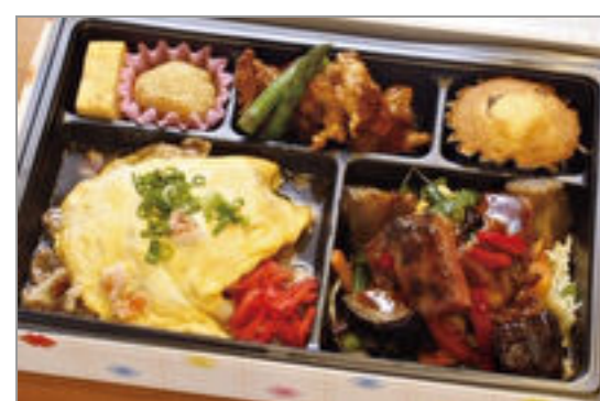
海鮮天津飯と和牛の中華炒め弁当 2,000円(税込2,160円) / 品番:KKDB015 お茶付き