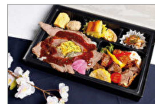
牛肉スタミナ弁当【期間限定2160円→1620円】