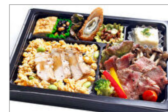
岡山和牛のローストビーフとピーチポークのそぼろご飯弁当 1,800円(税込1,944円) / 品番:KKDB021 お茶付き