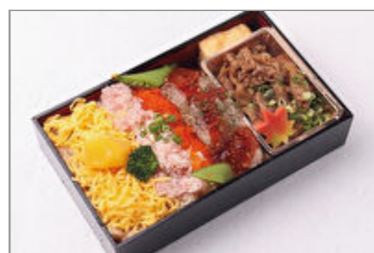
名物すき焼きと秋の華やか和膳