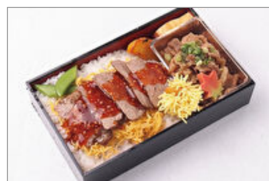
名物すき焼きとステーキ和膳