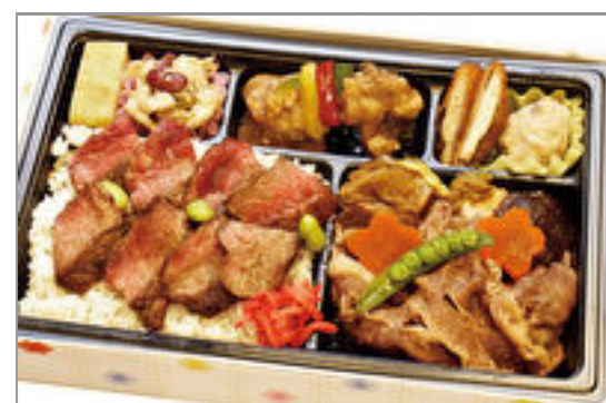
肉スペシャル弁当 1,800円(税込1,944円) / 品番:KKDB012 お茶付き