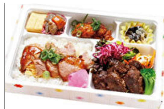
和牛ローストビーフとハラミの贅沢食べ比べ弁当 2,000円(税込2,160円) / 品番:KKDB009 お茶付き