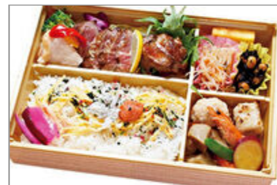
肉の三種・食べ比べ弁当 2,000円(税込2,160円) / 品番:KKDB010 お茶付き