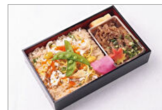
鯛めしとすき焼きのあい菜弁当