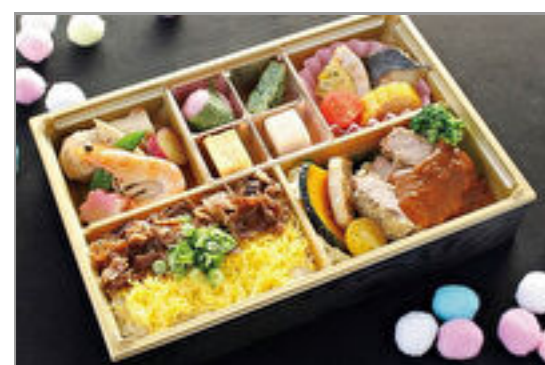
特製・デミグラス牛カツ弁当