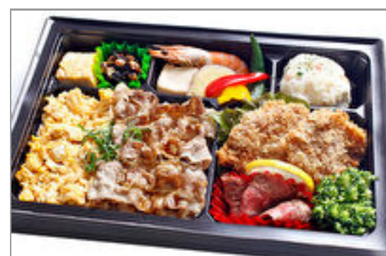
和牛カルビとヘレかつのコンビ弁当 1,800円(税込1,944円) / 品番:KKDB022 お茶付き