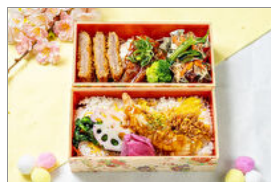
春野菜と牛カツと海老天弁当

商品によっては、注文条件やオプション・サービス等がございますので、詳しくは WEB でご確認ください。