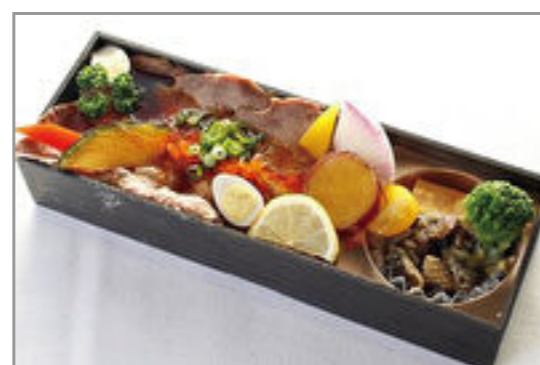
こぼれローストビーフと華やか野菜弁当