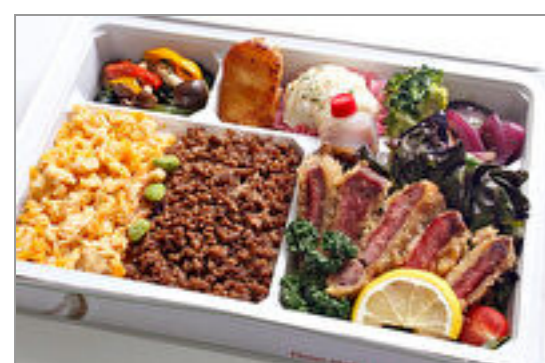
岡山和牛の牛カツと2色そぼろご飯弁当 2,000円(税込2,160円) / 品番:KKDB018 お茶付き