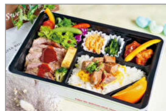
特選ステーキと特上サイコロステーキ 一梅