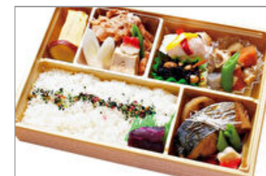
旬の煮魚と国産牛のすき焼き欲張り弁当