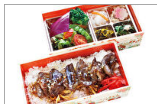
特選 焼肉弁当 2,000円(税込2,160円) / 品番:KKDD031 お茶付き