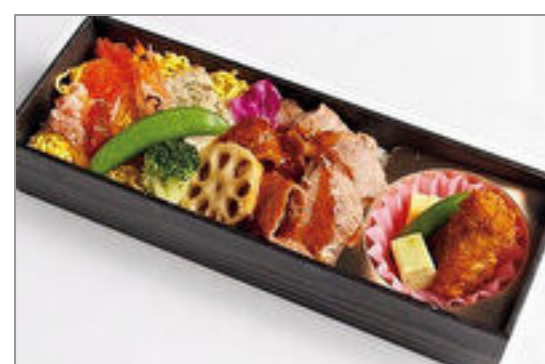
海鮮とステーキの特製弁当