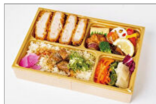
霜降り三元豚とサイコロステーキご飯弁当