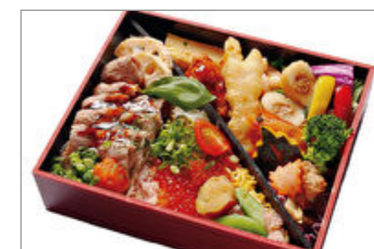
いくらとローストビーフの2色弁当