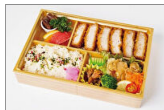
霜降り三元豚と岡山地鶏の照り焼き弁当(デザート付き)