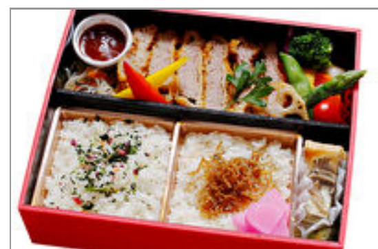
牛カツのご馳走重 1,800円(税込1,944円) / 品番:KKDD025 お茶付き