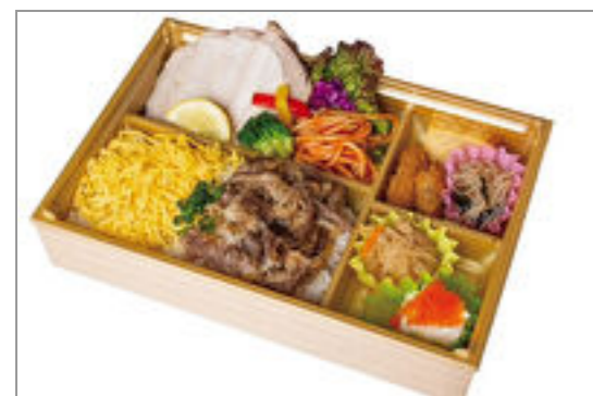
肉めしとピーチポークのコンビ弁当