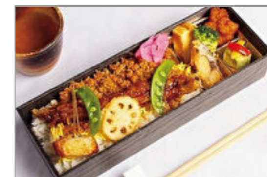
瀬戸内穴子の一本揚げ・贅沢弁当