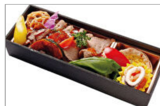
四季のローストビーフ弁当