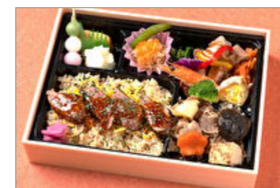
炙り牛肉ステーキとすき焼き弁当