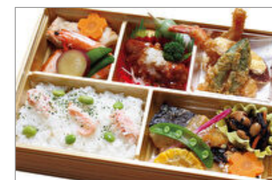
和の極み弁当 2,000円(税込2,160円) / 品番:KKDD033 お茶付き