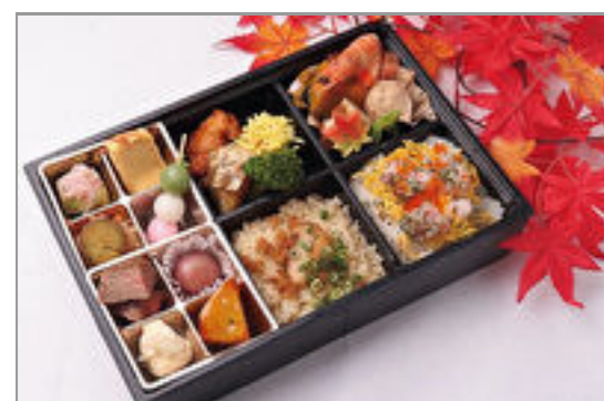
華やかご飯の色彩御膳