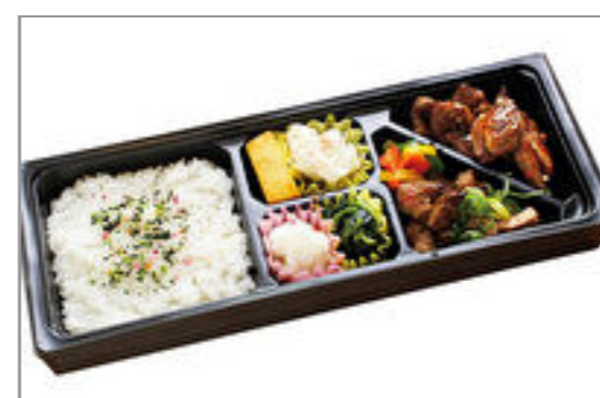
中落ちカルビとロースのコンビ弁当 1,500円(税込1,620円) / 品番:KKDD029 お茶付き