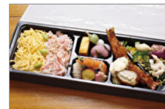
蟹チラシ弁当 1,800円(税込1,944円) / 品番:KKDD036 お茶付き