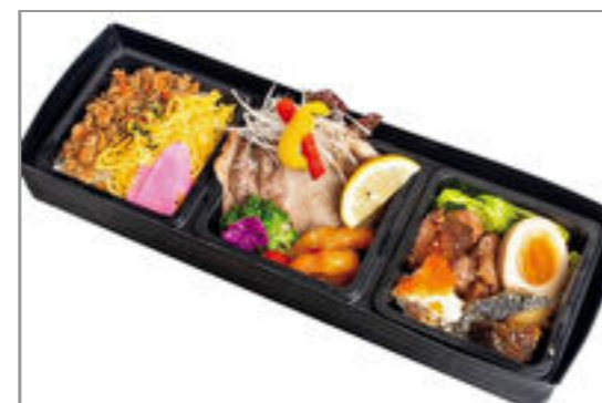
イベリコ豚の焼きしゃぶとサイコロステーキの特製弁当