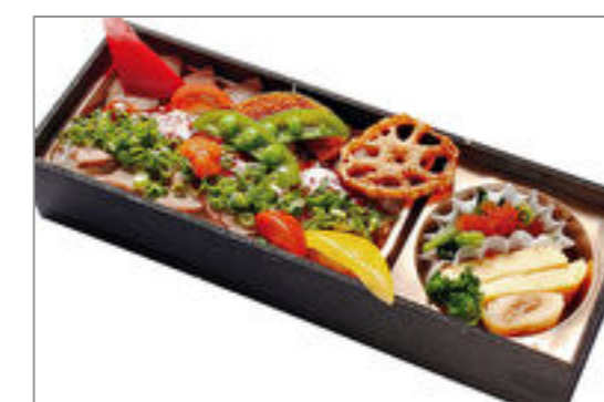
和牛の焼きしゃぶ弁当