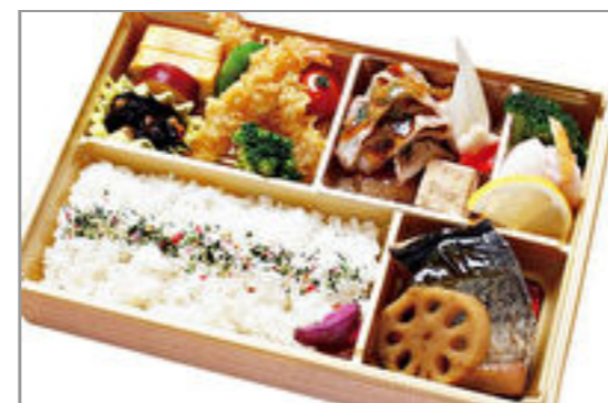
旬の煮魚と国産牛の華やか御膳 2,000円(税込2,160円) / 品番:KKDD023 お茶付き