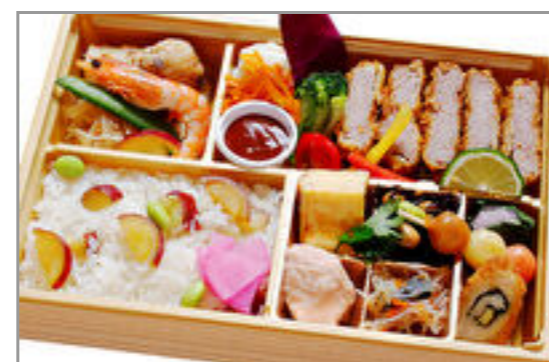
牛カツの幕の内弁当 2,000円(税込2,160円) / 品番:KKDD026 お茶付き