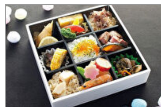
すずらん和風膳【期間限定 2160円→1620円】