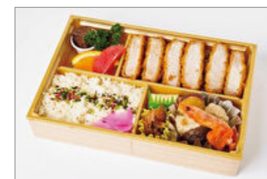
霜降り三元豚和膳