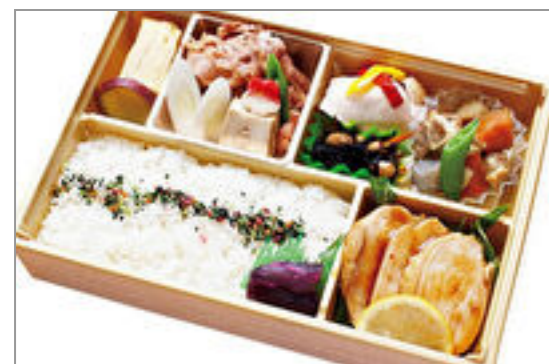
吉備高原鶏の照り焼きと国産牛のすき焼き弁当 1,800円(税込1,944円) / 品番:KKDD022 お茶付き