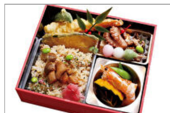
秋の松茸・味覚三昧