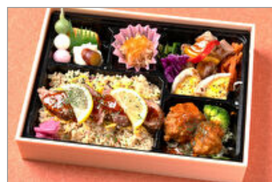
炙り牛肉ステーキご飯のちそう弁当