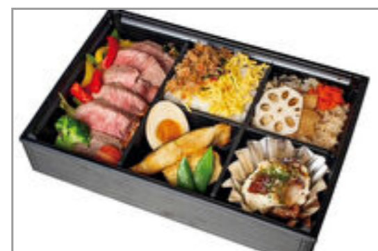
和牛のステーキと煮魚弁当