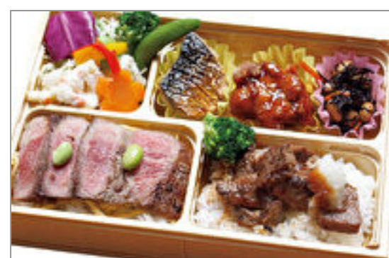
肉!弁当 1,500円(税込1,620円) / 品番:KKDD028 お茶付き