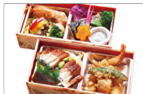
瀬戸の恵み弁当 1,800円(税込1,944円) / 品番:KKDD034 お茶付き