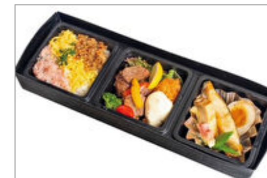
瀬戸内産牡蠣フライとカレーの煮付け和膳