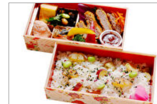
こだわり牛カツと選べるご飯の二段弁当 1,500円(税込1,620円) / 品番:KKDD024 お茶付き