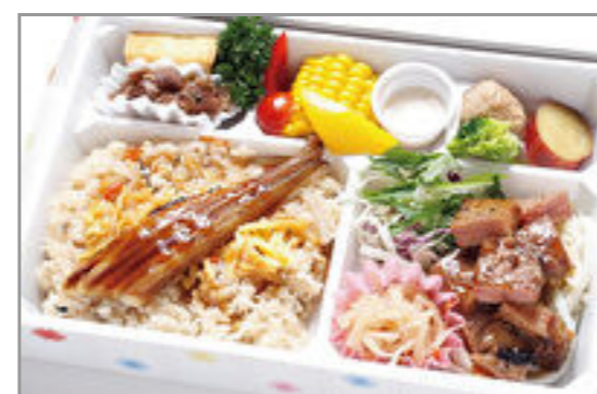
穴子飯とサイコロステーキ弁当 1,500円(税込1,620円) / 品番:KKDD035 お茶付き