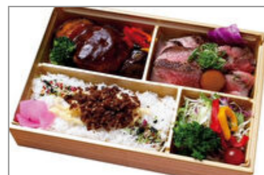
特選牛のローストビーフと自家製デミグラスハンバーグ弁当