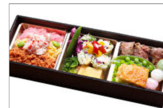
ほのか弁当 1,500円(税込1,620円) / 品番:KKDD027 お茶付き