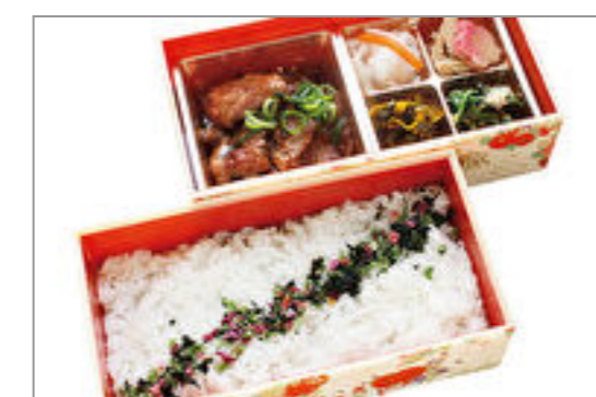
特選 中落ちカルビ弁当 1,800円(税込1,944円) / 品番:KKDD030 お茶付き