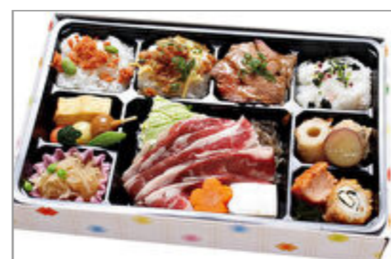
季節の贅沢弁当 1,500円(税込1,620円) / 品番:KKDD032 お茶付き