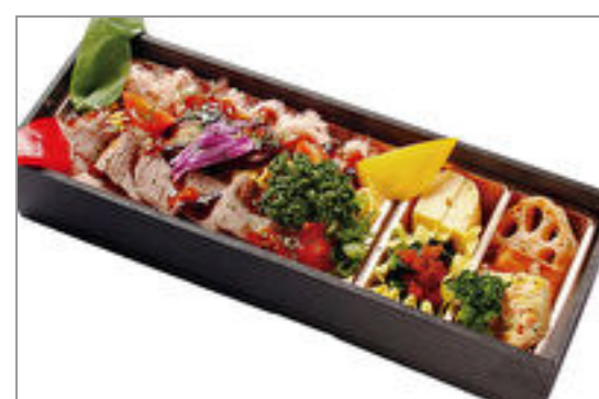
フォアグラと蟹とローストビーフのトリプル弁当