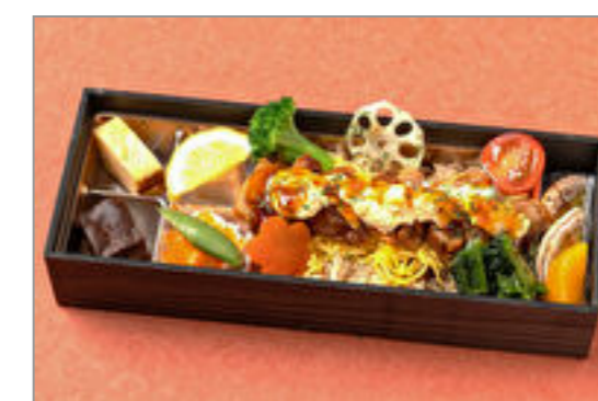
旬の野菜と鶏めしのタルタル焼き弁当 1,500円(税込1,620円) / 品番:KKDE009 お茶付き