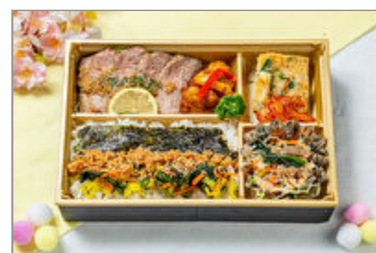
キンパご飯と韓流ステーキ弁当 2,315円(税込2,500円) / 品番:KKDE014 お茶付き