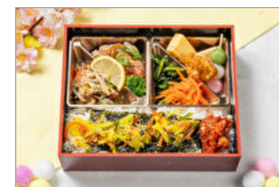
キンパご飯の春弁当 1,800円(税込1,944円) / 品番:KKDE015 お茶付き