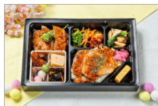
春野菜の肉ステーキ弁当 1,500円(税込1,620円) / 品番:KKDE012 お茶付き

商品によっては、注文条件やオプション・サービス等がございますので、詳しくは WEB でご確認ください。