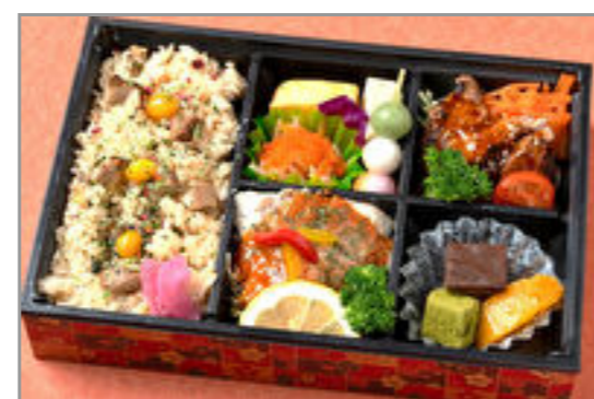
松茸ご飯とハラミステーキ弁当 1,800円(税込1,944円) / 品番:KKDE011 お茶付き