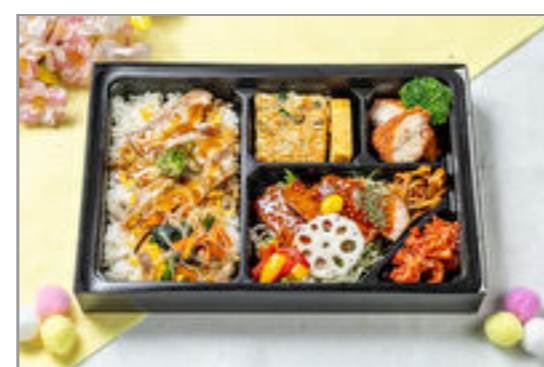
サムギョプサルご飯とステーキ弁当 1,500円(税込1,620円) / 品番:KKDE016 お茶付き