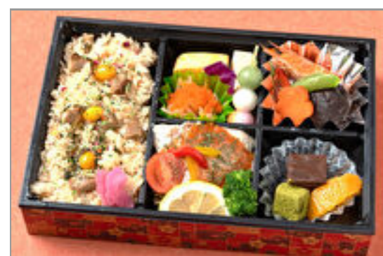
松茸ご飯の華弁当 1,500円(税込1,620円) / 品番:KKDE010 お茶付き