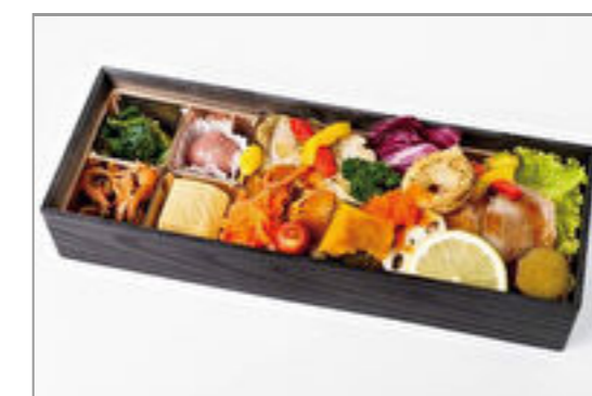
ローストビーフとグリルチキンのカラフル御膳 2,000円(税込2,160円) / 品番:KKDE001 お茶付き