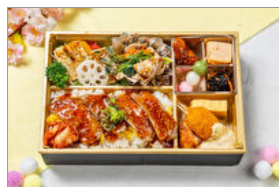
焼肉ご飯の特製弁当 2,000円(税込2,160円) / 品番:KKDE013 お茶付き