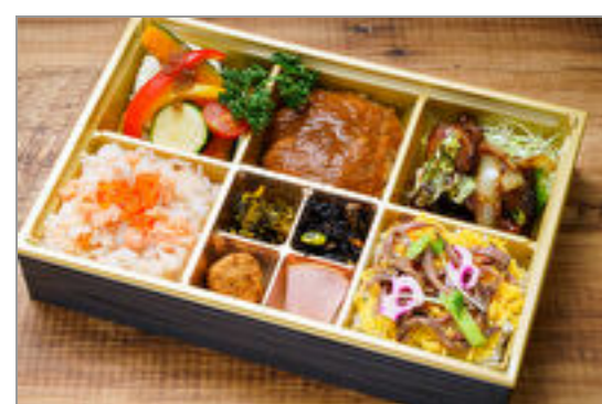
アジタート～ミンチカツと豚の甘辛炒め弁当～