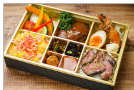
カンタービレ～希少部位の焼肉と自家製ハンバーグ弁当～

商品によっては、注文条件やオプション・サービス等がございますので、詳しくは WEB でご確認ください。