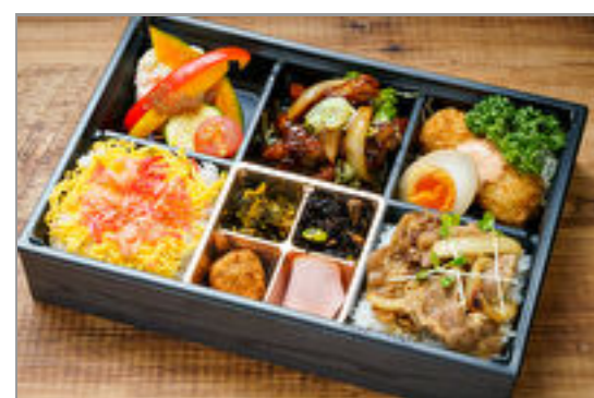
アマービレ～2種のご飯と豚の甘辛炒め弁当～