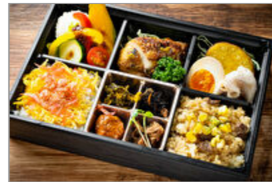
アマービレ～鶏の柚子胡椒 焼きとペッパーライス弁当 ～