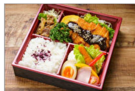
コモド～味噌カツと牛カルピ弁当～