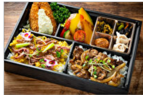
アニマート～お肉二色弁当 ～