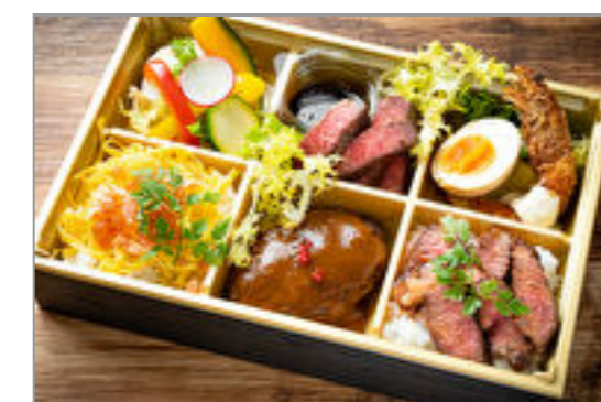
フィーネ～イチボステーキとリブロースの焼肉弁当～