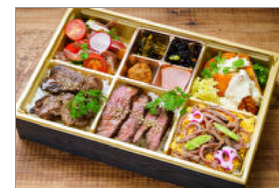
リテノート～お肉三色弁当～