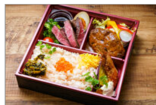
アルペジオ～リブロースステーキと自家製ハンバーグ弁当～