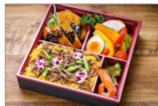
ブリランテ～肉まぶしご飯と味噌カツ弁当～