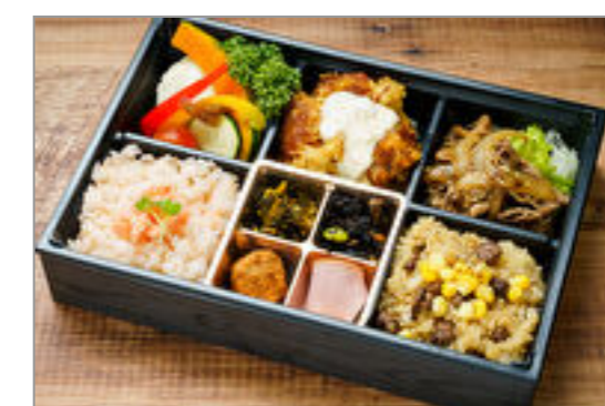
アニマート～2種のご飯とチキン南蛮弁当～