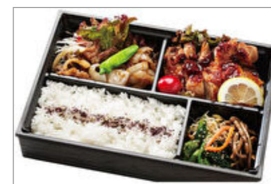
焼肉・鶏照り焼き膳