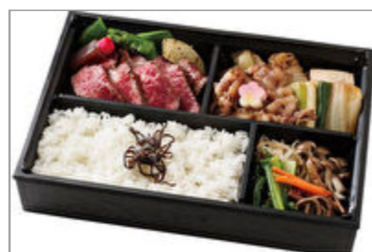
ステーキ・すき焼き膳