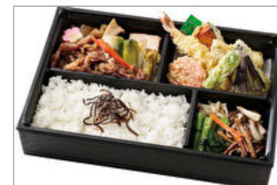
すき焼き・天ぷら膳