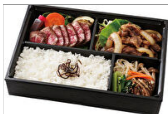
ステーキ・焼肉膳

商品によっては、注文条件やオプション・サービス等がございますので、詳しくは WEB でご確認ください。