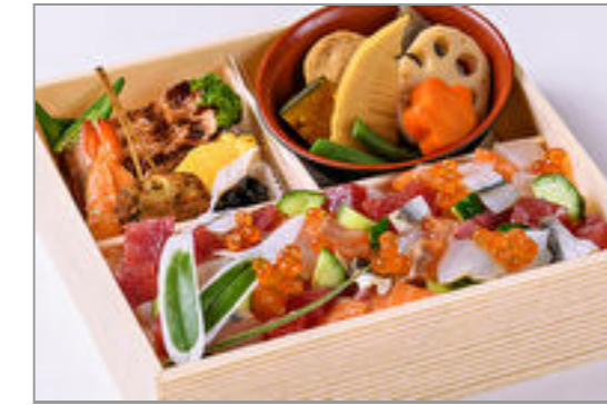
海宝ばらチラシ重