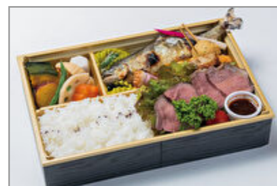
牛ステーキと鮎の塩焼き膳