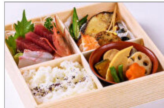
旬のお造りと銀だら西京焼膳