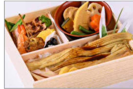
煮あなごめし懐石重