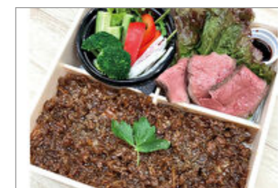
牛しぐれ煮飯とローストビーフの肉懐石重