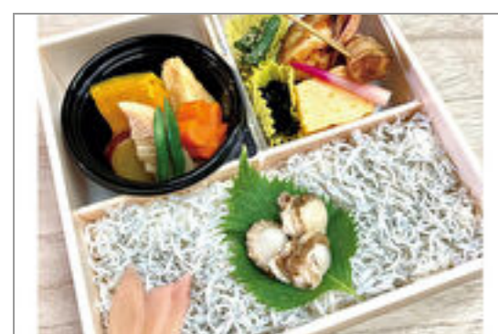
釜揚げしらすとホタテ懐石重