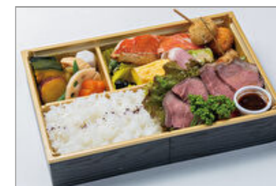
牛ステーキと金目鯛の西京焼き膳