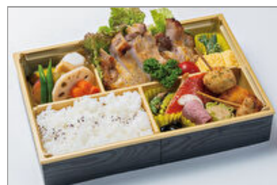
豚ロース西京焼き膳