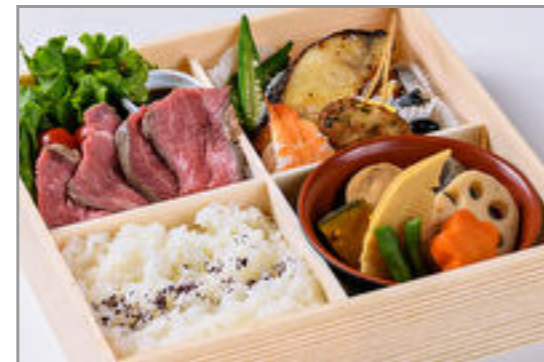
牛ステーキと銀だら西京焼膳