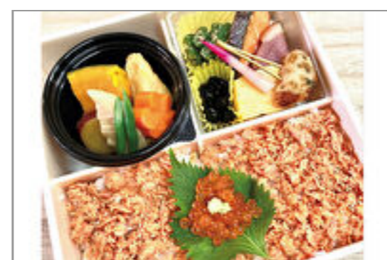
鮭いくらの親子懐石重