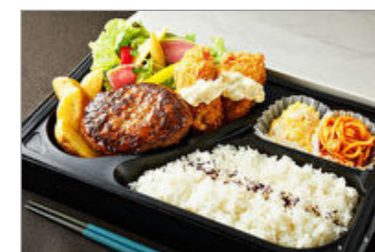
とろけるハンバーグ&カキフライ弁当