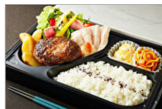
とろけるハンバーグ&蒸し鶏弁当