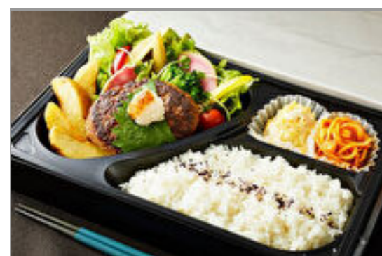
とろけるおろしハンバーグ弁当