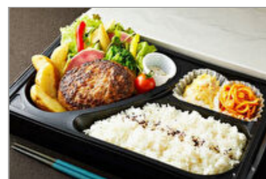
とろけるハンバーグ弁当(トリュフ塩)