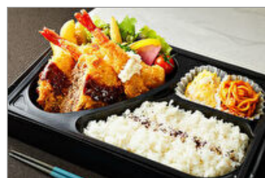
デミメンチカツ&大海老フライ弁当

商品によっては、注文条件やオプション・サービス等がございますので、詳しくは WEB でご確認ください。