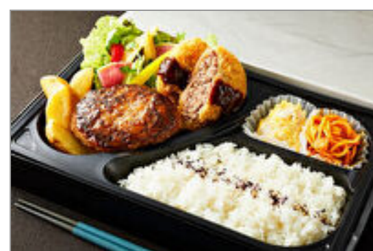
とろけるハンバーグ&牛タンメンチカツ弁当