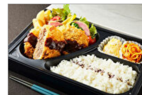
デミメンチカツ弁当