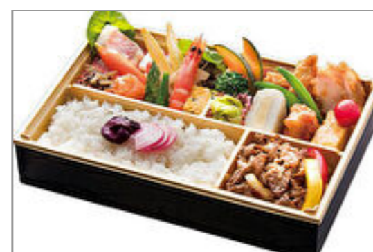
黒毛和牛焼肉の洋風懐石弁当