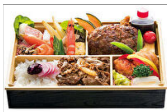
黒毛和牛ハンバーグ&焼肉の洋風懐石弁当

商品によっては、注文条件やオプション・サービス等がございますので、詳しくは WEB でご確認ください。