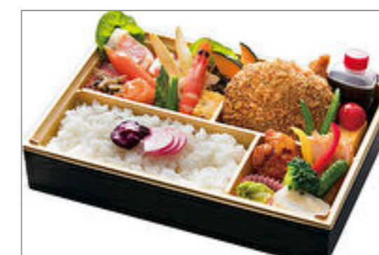
黒毛和牛バーグカツの洋風懐石弁当