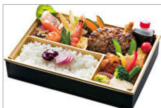
黒毛和牛ハンバーグの洋風懐石弁当