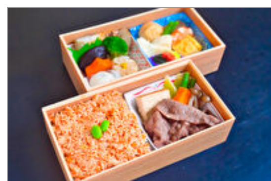
牛すき焼きと鮭ほぐしご飯の二段重