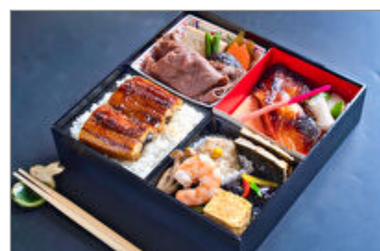
うなぎ、牛すき焼き、メロウ西京味噌漬け焼き、松花堂弁当『結(むすび)』／特選スタイル