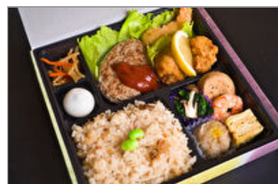
ハンバーグ唐揚げエビフライ和食スタンダード弁当 1,852円(税込2,000円) / 品番:STDB061 お茶付き