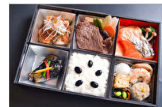
法事『澤(みお)』すき焼き、鮭ハラス焼き6マス仕出し弁当 3,473円(税込3,750円) / 品番:STDB063 お茶付き