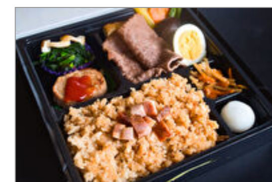
黒豚炊き込みご飯と牛すき焼きスタンダード弁当