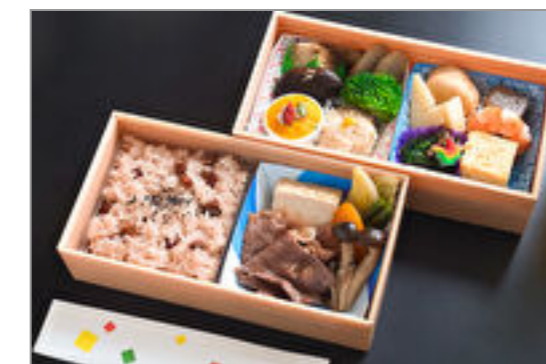
赤飯とすき焼き二段重/特選スタイル 3,473円(税込3,750円) / 品番:STDB082 お茶付き