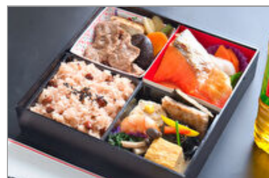
赤飯とすき焼き松花堂弁当/特選スタイル 3,704円(税込4,000円) / 品番:STDB083 お茶付き