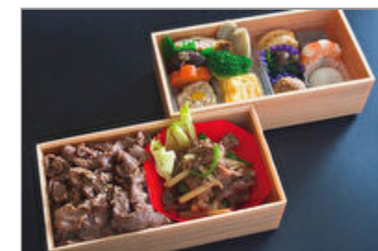
牛肉とタケノコ炒めとプルコギビーフご飯二段重 2,315円(税込2,500円) / 品番:STDB013 お茶付き