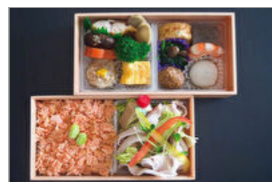
豚しゃぶと自家製シャケご飯二段重 2,315円(税込2,500円) / 品番:STDB016 お茶付き