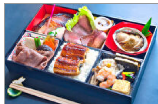
うなぎ、鮑酒蒸しと牛ステーキ6マス仕出し弁当『紬(つむぎ)』／特選スタイル