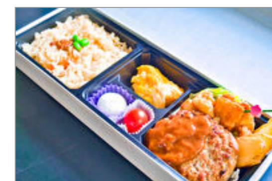
子供様ハンバーグ弁当 1,389円(税込1,500円) / 品番:STDB076 お茶付き