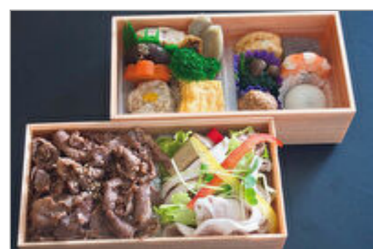
豚しゃぶとプルコギビーフご飯二段重 2,315円(税込2,500円) / 品番:STDB014 お茶付き