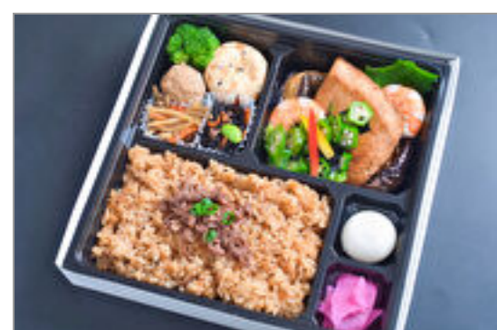
カジキマグロのオクラかけと黒豚炊き込みご飯仕出し弁当