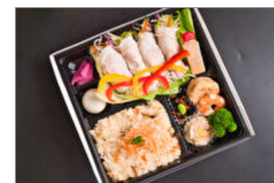
豚しゃぶサラダロールと鮭五目炊き込みご飯スタンダード弁当