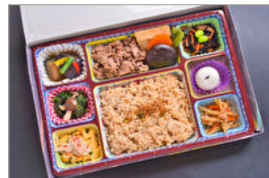
牛焼きすき焼き風&黒豚炊き込みご飯はんわり膳