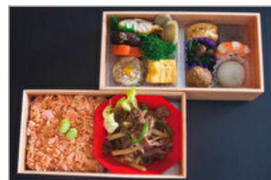
牛肉とタケノコ炒めと自家製シャケほぐしご飯二段重 2,315円(税込2,500円) / 品番:STDB012 お茶付き