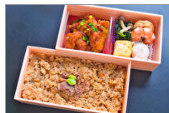
鳥唐揚げネギソース漬けと牛肉ごぼうの炊き込みご飯二段重弁当 2,000円(税込2,160円) / 品番:STDB059 お茶付き