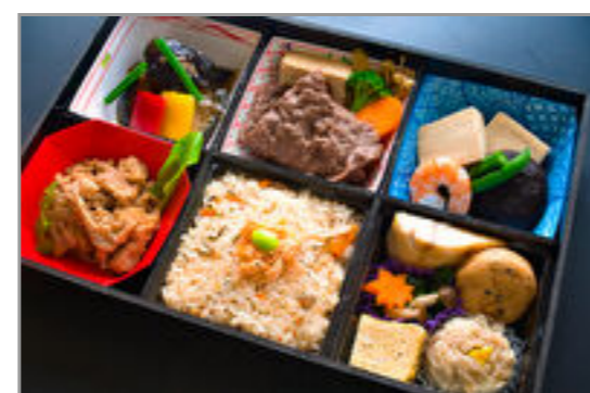
牛すき焼き、焼肉、高野豆腐6マス仕出し弁当 3,149円(税込3,400円) / 品番:STDB062 お茶付き