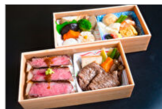
牛ステーキと牛すき焼き特選二段重箱