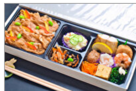
豚バラ焼肉のせご飯と副菜いろいろ弁当