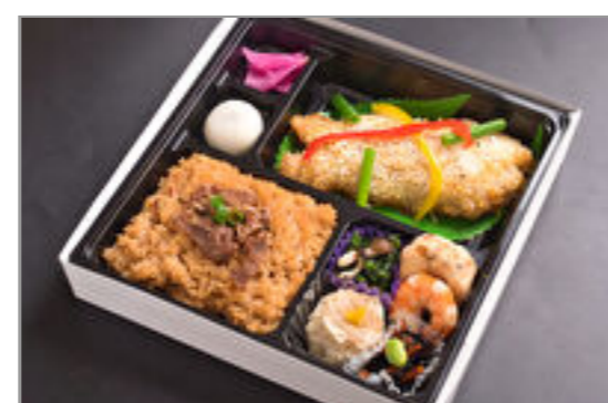
カラスガレイのパン粉焼きと黒豚炊き込みご飯スタンダード弁当