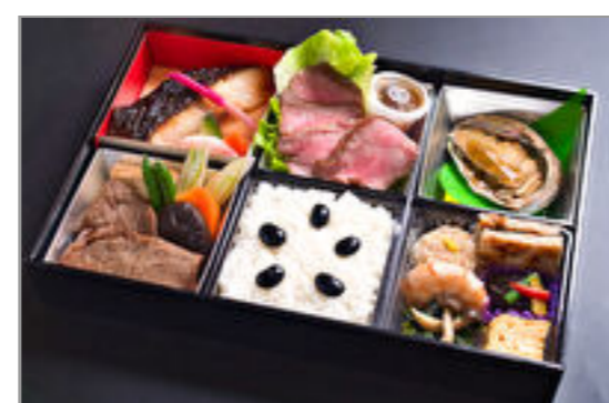
法事『紬(つむぎ)』あわび酒蒸しと牛ステーキ6マス弁当／特選スタイル