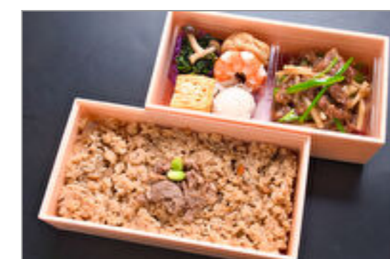
牛肉と竹の子和風炒め&牛肉とごぼうの炊き込みご飯二段重 2,000円(税込2,160円) / 品番:STDB060 お茶付き