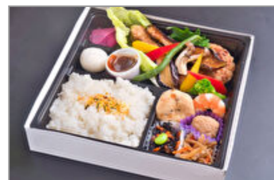
ハンバーグ野菜のせ和風ソーススタンダード弁当