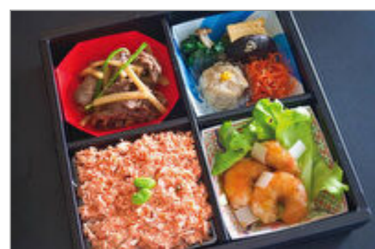
牛肉タケノコ炒め、エビチリ、しゃけご飯松花堂 2,315円(税込2,500円) / 品番:STDB021 お茶付き