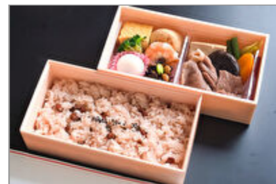
赤飯二段重 2,500円(税込2,700円) / 品番:STDB081 お茶付き