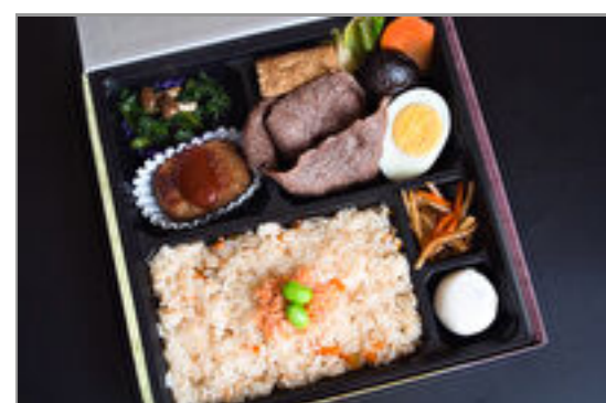
鮭の五目炊き込みご飯と牛すき焼きスタンダード弁当