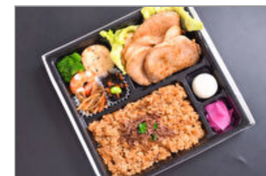
豚ロース生姜焼きと黒豚炊き込みご飯スタンダード弁当