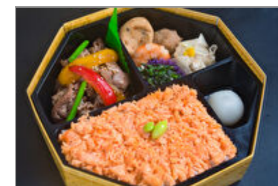
プルコギ牛焼きと鮭ごはん弁当