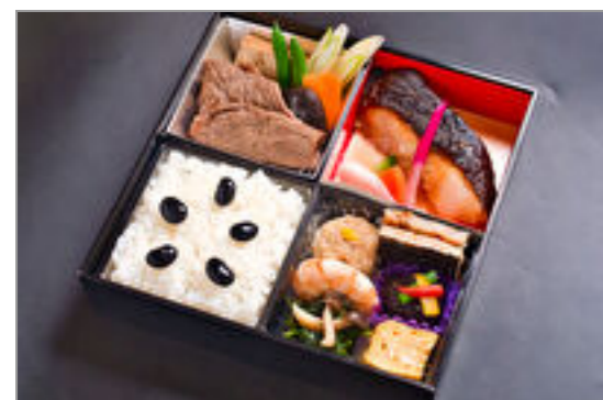
法事『結(むすび)』牛すき焼き、メロウ西京味噌漬け焼き松花堂／特選スタイル