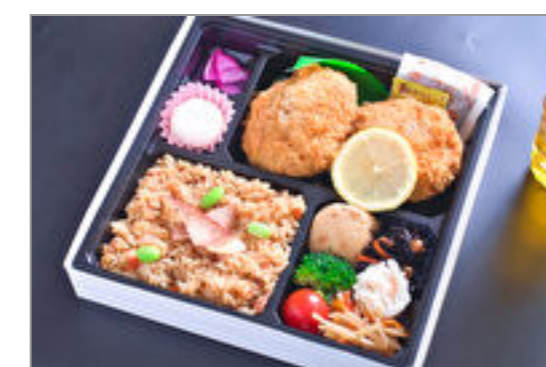
牛肉メンチカツ弁当