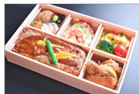
薄焼きビーフハンバーグ弁当