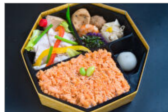
豚しゃぶと鮭ご飯八角弁当 2,000円(税込2,160円) / 品番:STDB041 お茶付き