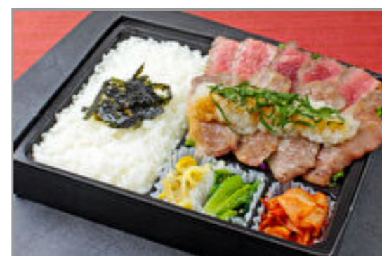
近江牛カルビとシンタマステーキおろしポン酢弁当