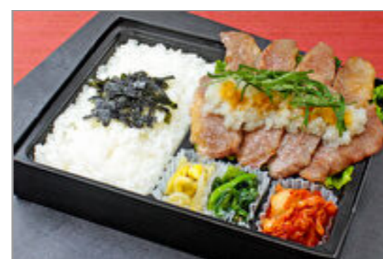
近江牛カルビとおろしポン酢弁当