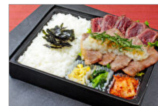
近江牛カルビと牛ハラミおろしポン酢弁当