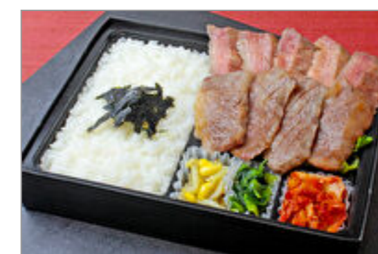
近江牛カルビと牛たん弁当