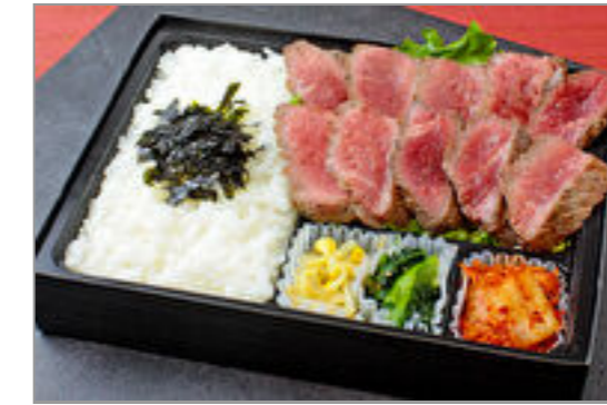
やわらかシタマステーキ弁当