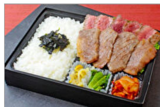
近江牛カルビとシンタマステーキ弁当