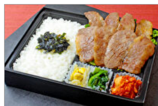
近江牛カルビ弁当

商品によっては、注文条件やオプション・サービス等がございますので、詳しくはWEBでご確認ください。