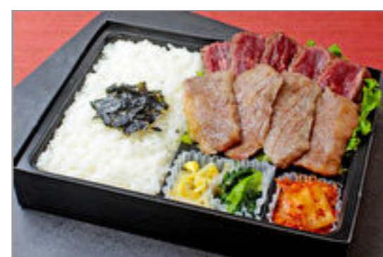
近江牛カルビと牛ハラミ弁当