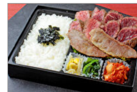
焼肉すだくの3種盛り(近江牛カルビ、牛ハラミ、シンタマステーキ)