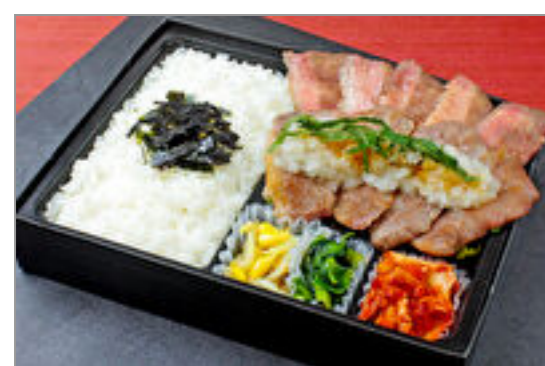
近江牛カルビと牛たんおろしポン酢弁当