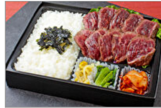
牛ハラミステーキ弁当